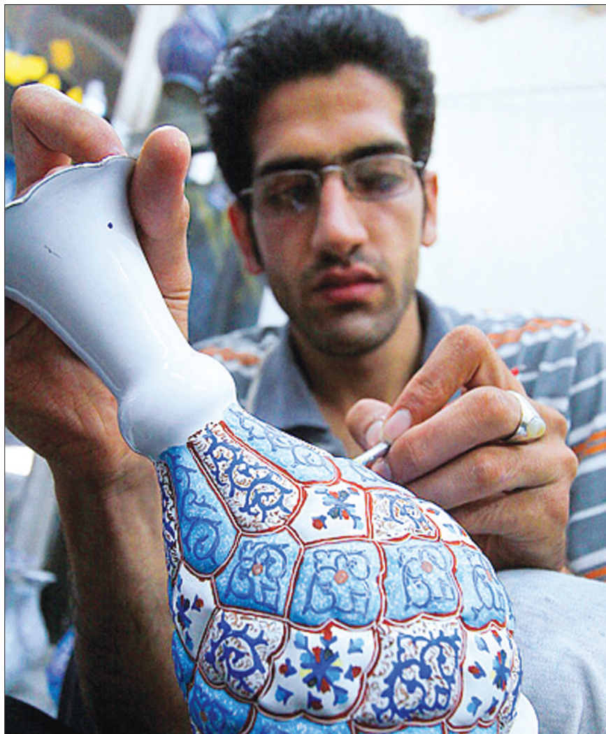
با وجود بیش از ۱۹۰ رشته فعال و نیمه فعال در حوزه صنایع دستی: