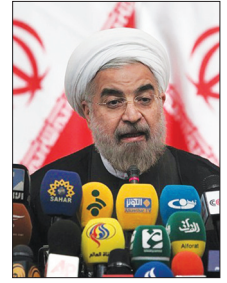
دولت مصمم به ایجاد ارتباط دوسویه و تنگاتنگ با رسانه هاست