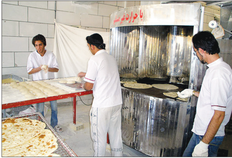
تسهیلات ویژه برای تهیه دستگاه‌های استاندارد پخت نان

چندروزی امتحان کن در صیام دوباره صدا می‌آید، صدای مناجات سحر، شور و بیداری، جمع شدن سرفره افطار، هموا شدن و جمع خوانی‌های قرآنی؛ همه اینها آمدن یک چیز را صدامی کنند، آمدن ماه رحمت و برکت، ماه تغییر و اصلاح. «شَهْرُ رَمَضَانَ الَّذِي أُنزِلَ فِيهِ الْقُرْآنُ، هُدًى لِّلنَّاسِ وَ بَيِّنَاتٍ مِّنَ الْهُدَى وَالْفُرْقَانِ» (سوره بقره آیه ۱۸۵) رمضان ماهی است که در آن قرآن کریم، این رهنمون بخش بشریت به سوی سعادت بر قلب مبارک پیامبر (ص) نازل شده است. بر اساس روایات اسلامی، همه کتاب‌های آسمانی «تورات»، «انجیل»، «زبور» و «قرآن» در این ماه بر عظمت نازل شده‌اند. روزه دارای برکات زیاد فردی است، همانگونه که در حدیث معروف پیامبر اکرم (ص) آمده است: «صوموا تصحوا؛ روزه دارید تا تندرت شوید.» (هر چیزی را زکاتی هست و زکات تن، روزه داشتن است) همچنین روزه دارای آثار اجتماعی و فرهنگی نیز هست که در ادامه به آن خواهیم پرداخت. با خواندن آیات قرآن و فهم واجب شدن روزه بر همگان، این درس بزرگ به انسان داده می‌شود که همه در پیشگاه خداوند بکسند و هیچ فرقی بین فقیر و غنی نیست و این همان رفع و مبارزه با طبقه بندی‌های اشتباه اجتماعی به فقیر و غنی است. در قرآن آمده است: «فَمَنْ شَهِدَ مِنْكُمُ الشَّهْرَ فَلْيَصُمْهُ وَ مَنْ كَانَ مَرِيضًا أَوْ عَلَى سَفَرٍ فَعِدَّةٌ مِّنْ أَيَّامٍ أُخَرَ يُرِيدُ اللَّهُ بِكُمُ الْيُسْرَ وَ لَا يُرِيدُ بِكُمُ الْعُسْرَ وَ...»