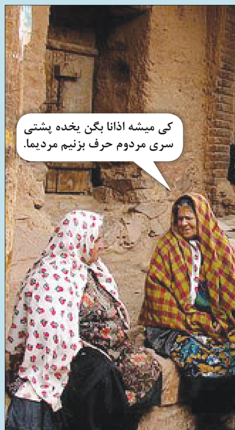
کی میشه اذانا بگن یخده پشتی سری مردوم حرف بزنییم مردیما.