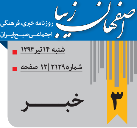
روزنامه خبری اصفهان

زرگر پور همچنین اذعان کرد: با انجام اقدامات کارشناسی و نظارت سازمان میراث فرهنگی و گردشگری و رعایت دقیق قوانین مربوطه در دولت تدبیر و امید تکمیل عملیات اجرایی خط یک مترو اصفهان از سر گرفته خواهد شد. استاندار اصفهان با بیان اینکه در چند ماه اخیر از مسوولین کشوری خواسته شد که برای حل این مشکل به اختیار سفر کنند و از نزدیک در جریان کامل تلاش ها و مشکلات مترو قرار گیرند، تصریح کرد: معاون رئیس جمهور و رئیس سازمان میراث فرهنگی و گردشگری کشور ابراز علاقه نشان دادند که برای حل این مشکل وارد عمل شوند.