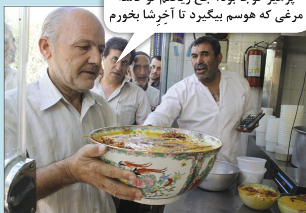
پرهیز کوچا بود؟ جخ ریختم تو کاسه مرغی که هوسم بیگیرد تا آخرشا بخورم