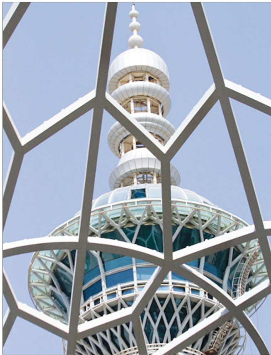
شبستان اصلی مصلاد در حال تکمیل است