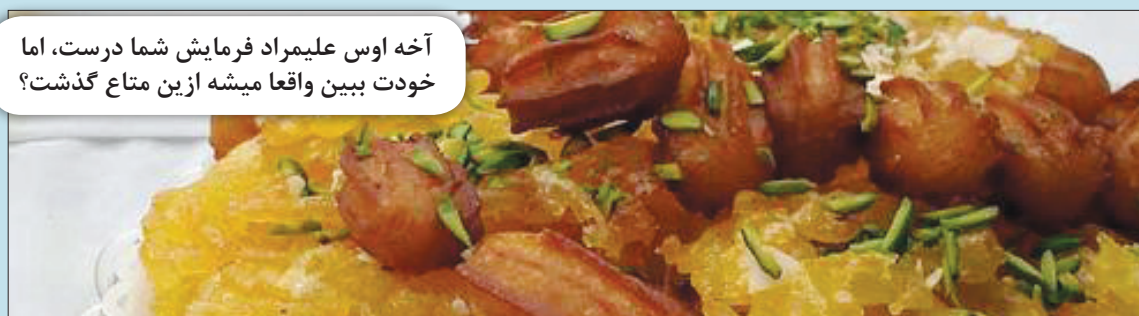
آخه اوس علیمراد فرمایش شما درست، اما خودت ببین واقعا میشه ازین متاع گذشت؟