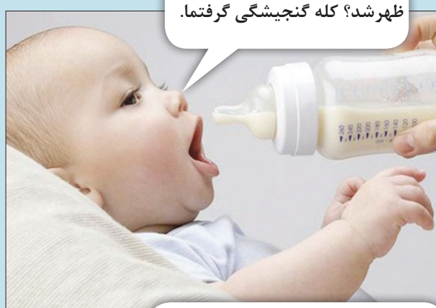
ظهر شد؟ کله گنجیشگی گرفتما.