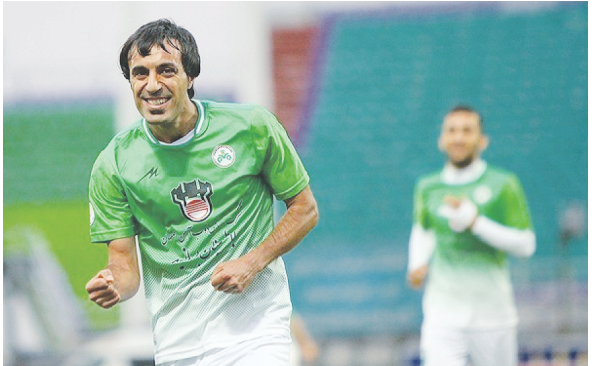
قرار داد بازیکن باشگاه محرمانه است؛