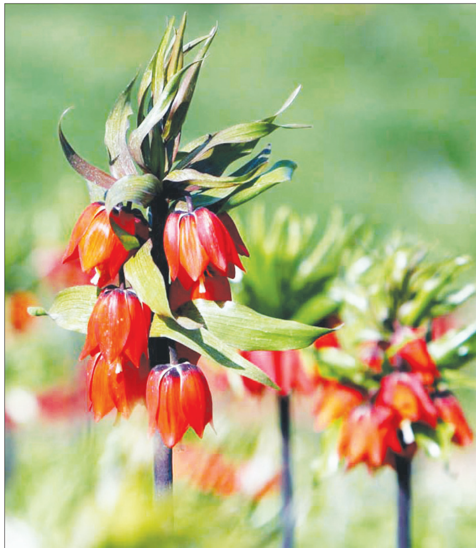
گیاهی که هر ساله مورد بی مهری ایرانیان است؛