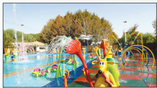
بازو بازی کودکان

اصلی با ظرفیت ۲۰۰ نفر ۲- سینمای چهار بعدی ؛ شامل یک فضای مجازی زیر دریا همراه با نمایش های سه بعدی با ظرفیت ۲۰۰ نفر ۳- گردش فضایی ؛ شامل قرار گرفتن در فضا و حرکت از میان کرات و اجسام فضایی است. ظرفیت ۱۰۰ نفر ۴- شهر دایناسورها ؛ شامل قرار گرفتن در شهری ویران شده توسط دایناسورها و حرکت سه بعدی در آن شهر. ظرفیت ۸۰ نفر ۵- استودیوی جلوه های ویژه ؛ شامل دو سالن با فضاهای مهیج و دیدنی و کار کترهای فرضی. ظرفیت ۳۰۰ نفر ۶- بازی های آبی ؛ شامل ۱۰ بازی جذاب و مهیج آبی در فضایی شاد و زیر نورهای رنگی. ظرفیت ۳۰۰ نفر ۷- بازی در فضای باز ؛ شامل ۱۱ بازی مدرن و مفرح برای سنین مختلف