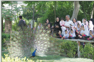
باغ پروانه گان

۳) ساختمان برج: این ساختمان که به شکل برج کبوتر تعبیه شده دارای دستگاه های جوجه کنی جهت تکثیر پروانه گان و شامل اتاق هایی برای نگهداری جوجه های تازه متولد شده و والدین در حال جفت یابی است. این باغ در چهار کیلومتری غرب پل وحید در حاشیه زاینده رود و در پارک طبیعی نازوان واقع شده است.