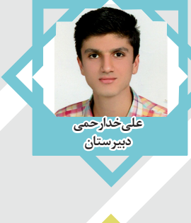
علی خداجوسی دبیرستان