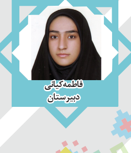
فاطمه کینا دبیرستان