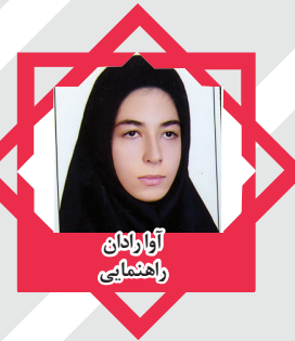
آزار روان راهنمایی