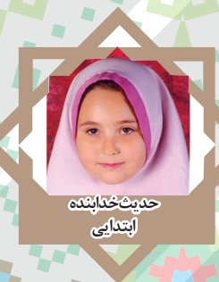
حدیث خدابنده ابتدایی