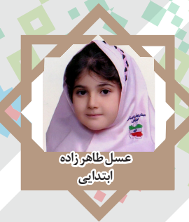
عسل طاهرزاده ابتدایی