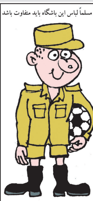
مسلماً لباس این باشگاه باید متفاوت باشد