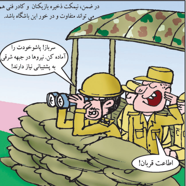
سرباز! باش خودت را آماده کن. نیروها در جبهه شرقی به پشتیبانی نیاز دارند!