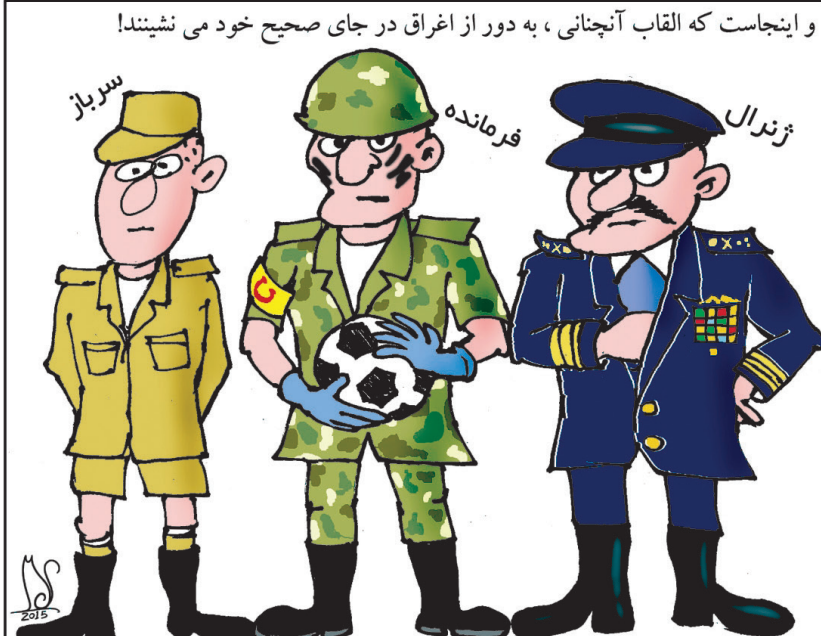
در ضمن، نیکم ذخیره بازیکنان و کادر فنی هم می تواند متفاوت و در خور این باشگاه باشد.