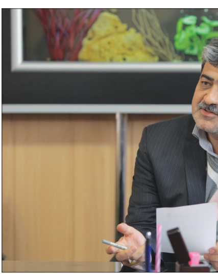
مدیر منطقه ۱۴ شهرداری اصفهان؛

روکش آسفالت به همراه مسیر عبور نابینایان در خیابان شهید مفتح یا هزینه ای بالغ بر سه میلیارد و ۵۰۰ میلیون ریال در منطقه اجرا شده است.