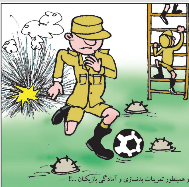
و همینطور تمرینات بدنسازی و آمادگی بازیکنان...!!

جام جهانی هندبال ۲۰۱۵ از پانزده ژانویه تا اول فوریه امسال در قطر برگزار شد و تیم ملی هندبال این کشور در حالی به عنوان اولین تیم غیر اروپایی در تاریخ این رقابت ها به فینال رسید که در ترکیب این تیم فقط یک بازیکن قطری الاصل دیده می شد و سایر بازیکنان قطر، هندبالیست های اروپایی بودند که به تابعیت این کشور کوچک آسیایی در آمده اند. این موضوع علاوه بر واکنش تیم های ملی هندبال جهان، حالا با واکنش منفی سب بلاتر رییس فدراسیون جهانی فوتبال هم مواجه شده است. بلاتر با مز خرف خواندن این موضوع گفته است: «قطر با جمعیتی ۲/۲ میلیون نفری برای تشکیل تیم ملی فوتبال خود با چالشی بزرگ مواجه است اما این دلیل نمی شود که این کشور به سرعت بازیکنان کشورهای دیگر را به تابعیت خود در آورد. ورزش می تواند فرهنگ کشورهای مختلف را به هم نزدیک کند اما آنچه در جام جهانی هندبال قطر اتفاق افتاد، این ایده را به ابتدال کشاند». قطر در سال ۲۰۲۰ میزبان جام جهانی فوتبال است و سب بلاتر به این کشور هشدار داده که رویه خود در تیم ملی هندبال را در مورد تیم ملی فوتبال خود تکرار نکند.