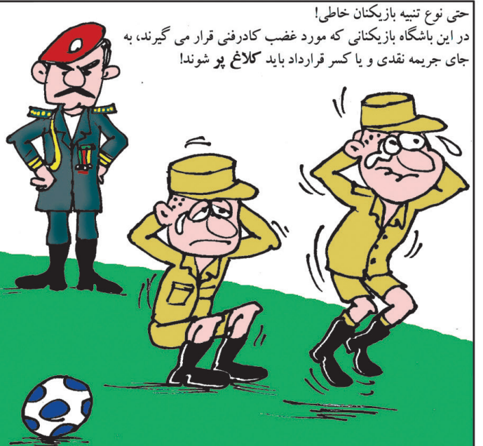
حتی نوع تنبیه بازیکنان خاطی! در این باشگاه بازیکنانی که مورد غضب کادرفنی قرار می گیرند، به جای جریمه نقدی و یا کسر قرارداد باید کلاغ پر شوند!