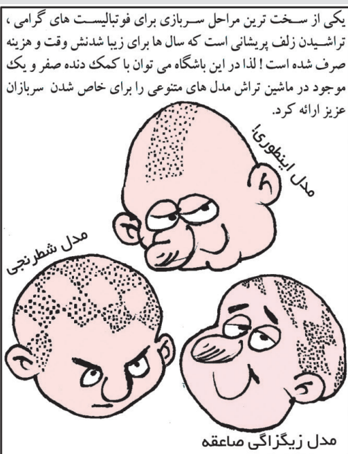
یکی از سخت ترین مراحل سربازی برای فوتبالیست های گرمی، تراشیدن زلف پریشانی است که سال ها برای زیبا شدنش وقت و هزینه صرف شده است! لذا در این باشگاه می توان با کمک دنده صفر و یک موجود در ماشین تراش مدل های متنوعی را برای خاص شدن سربازان عزیز ارائه کرد.