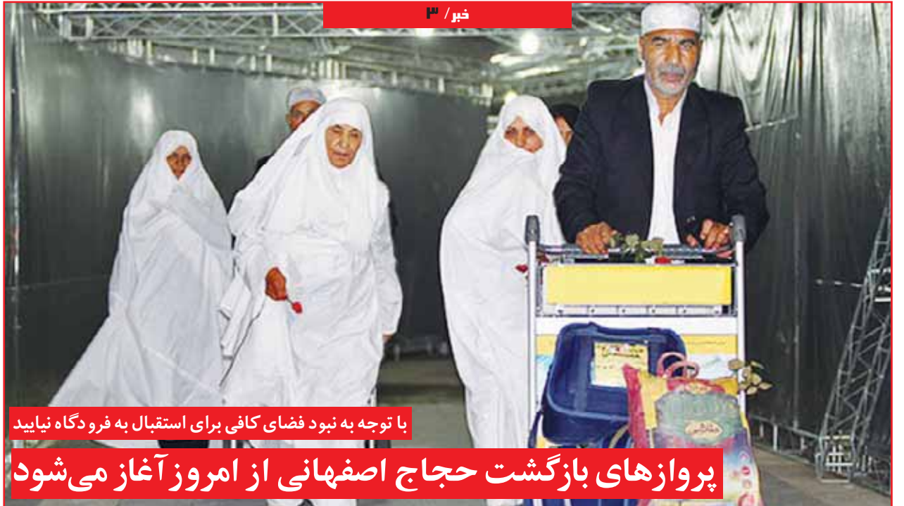
با توجه به نبود فضای کافی برای استقبال به فرو دگاه نیاید پروازهای بازگشت حجاج اصفهانی از امروز آغاز می شود

استاندار اصفهان در شورای هماهنگی مبارزه با مواد مخدر استان: