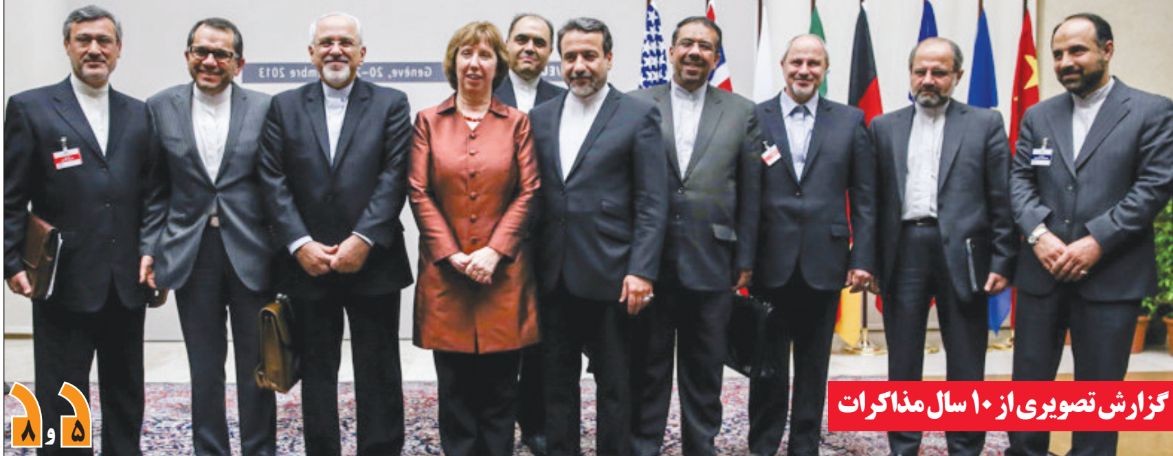
گزارش تصویری از ۱۰ سال مذاکرات