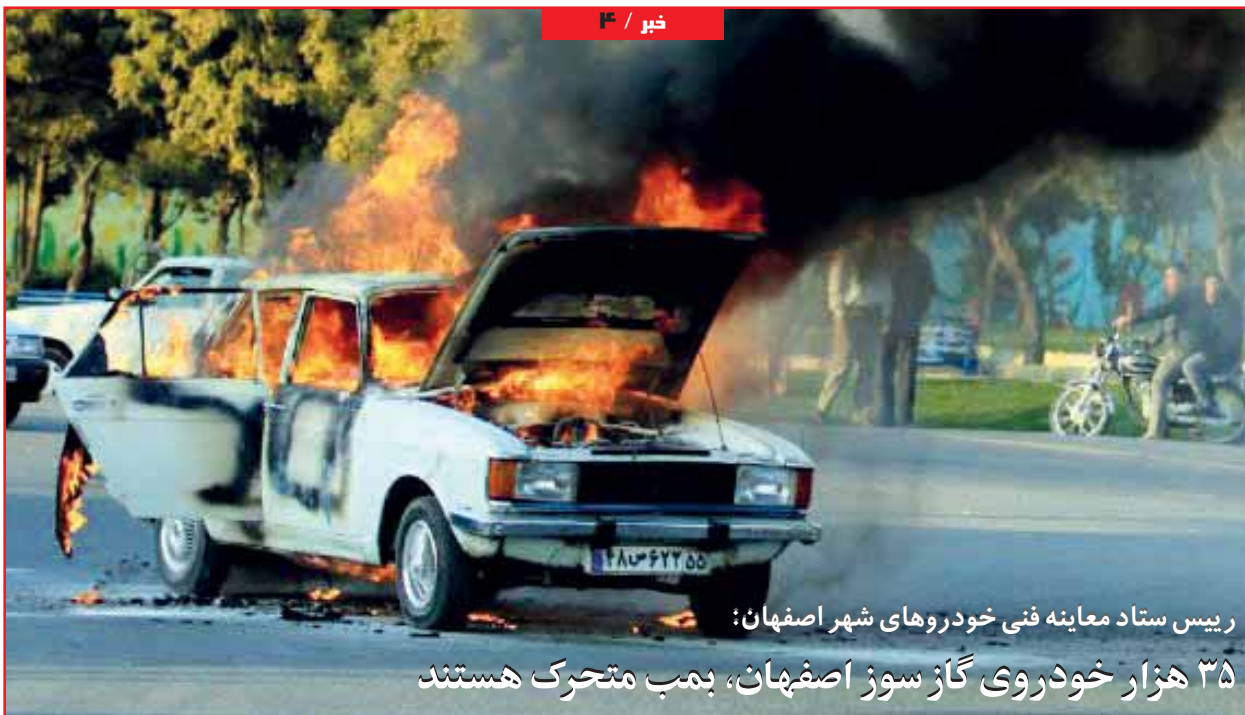
رئیس ستاد معاینه فنی خودروهای شهر اصفهان: ۳۵ هزار خودروی گاز سوز اصفهان، بمب متحرک هستند