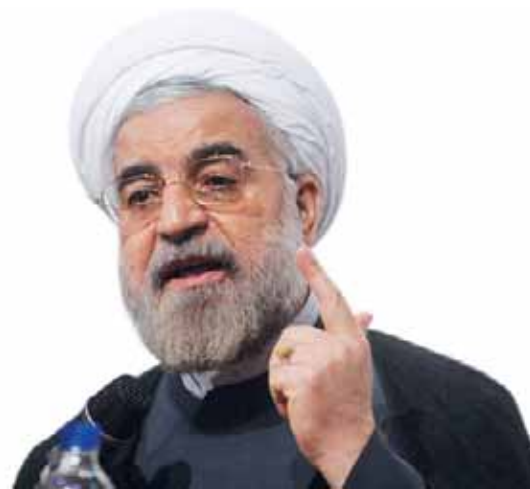
دکتر روحانی در دانشگاه شهید بهشتی:

بهبود معیشت و رفاه مردم و شکستن تحریم‌های ظالمانه حق مسلم ماست