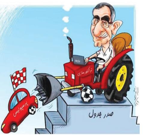
در حاشیه برد تراکتور