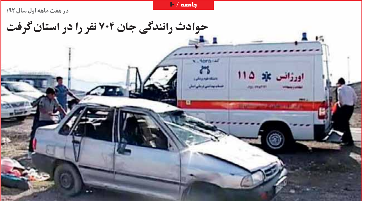
در هفت ماهه اول سال ۹۲:

حوادث رانندگی جان ۷۰۴ نفر را در استان گرفت