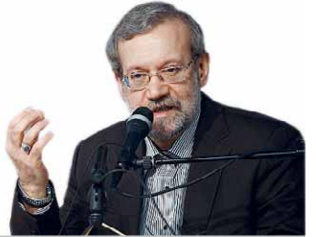
دکتر لاریجانی در نشست خبری با اصحاب رسانه در عمان:

رژیم صهیونیستی وزنی ندارد که بر ۵+۱ تأثیرگذار باشد