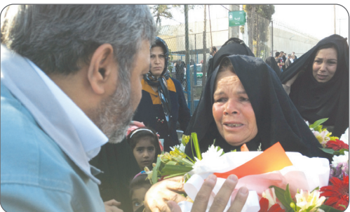
گزارش دو گروه جامعه

در صحنه زندگی بشر کمتر کسی را می توان یافت که از عیب پاک بوده و از