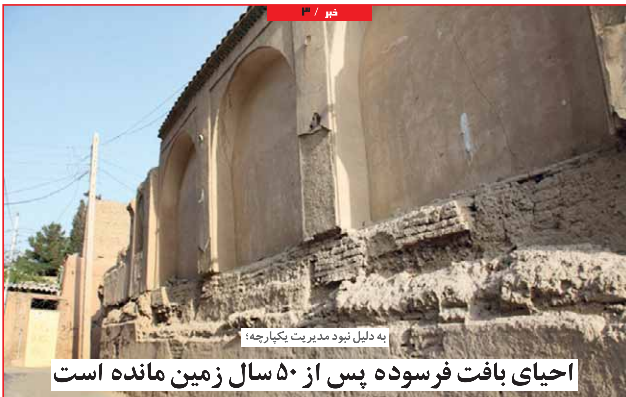
به دلیل نبود مدیریت یکپارچه:

احیای بافت فرسوده پس از ۵۰ سال زمین مانده است