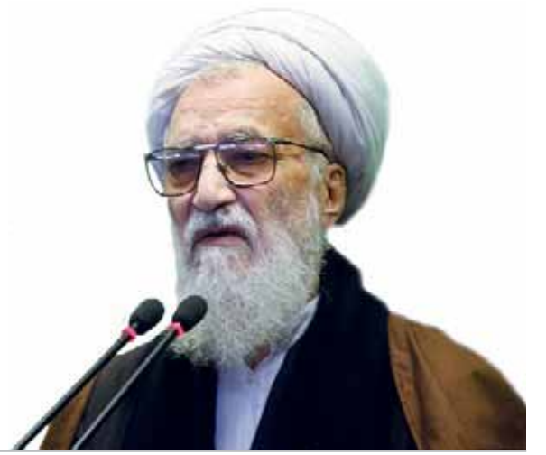
آیت‌الله موحدی کرمانی در خطبه‌های نماز جمعه تهران:

اگر از دشمنان غافل شویم قطعا ضربه خواهیم خورد