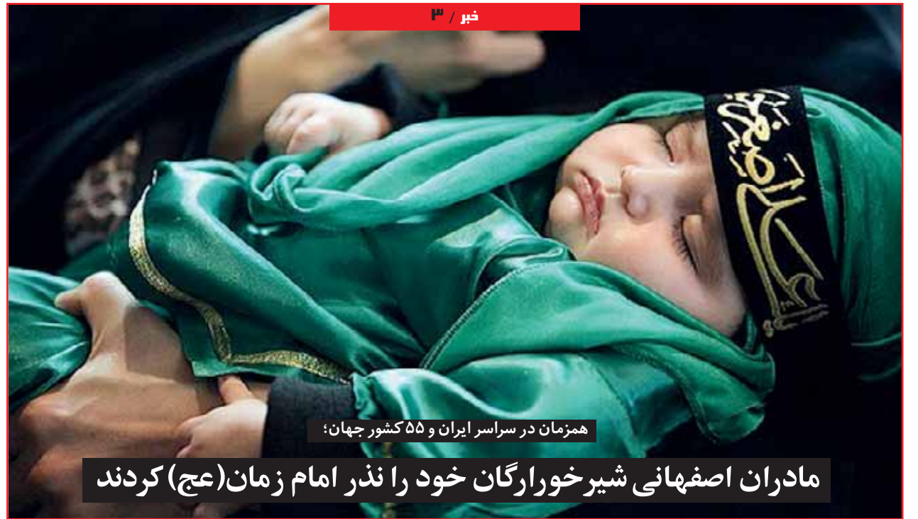
همزمان در سراسر ایران و ۵۵ کشور جهان:

مادران اصفهانی شیرخوارگان خود را نذر امام زمان (عج) کردند