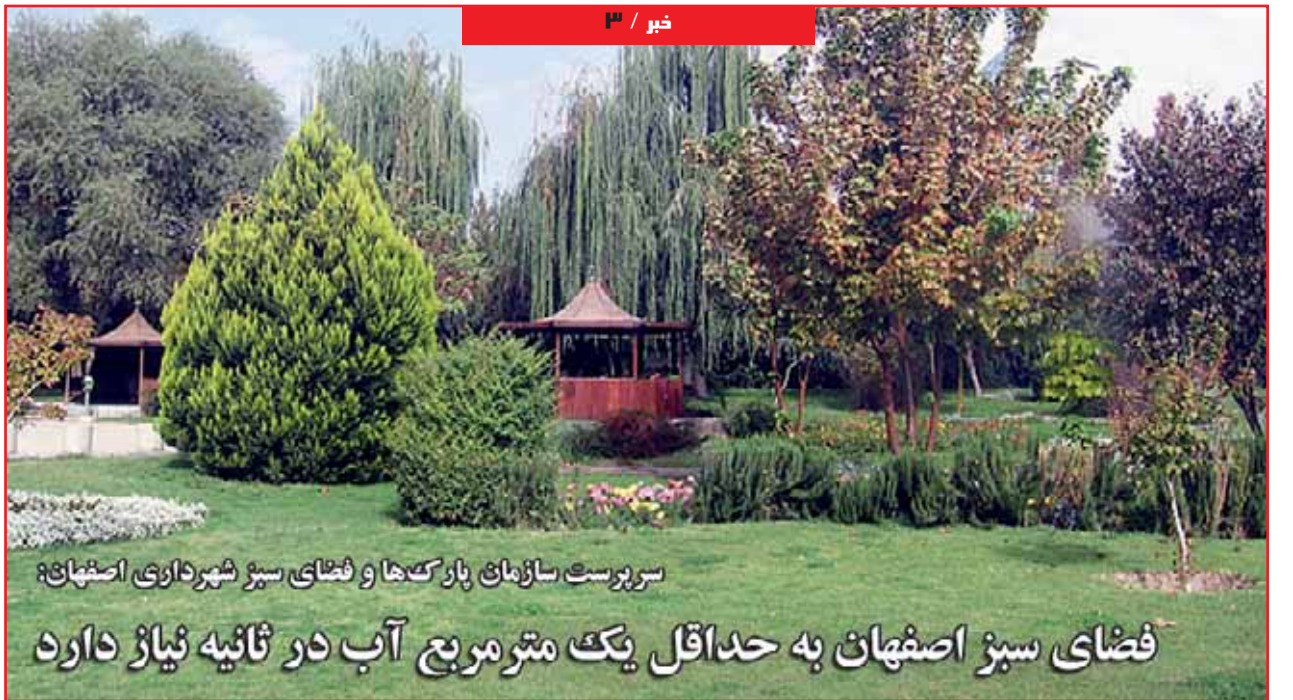
سرپرست سازمان پارک‌ها و فضای سبز شهرداری اصفهان: فضای سبز اصفهان به حداقل یک مترمربع آب در ثانیه نیاز دارد