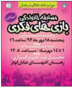
خانه خلاقیت رهنان در مورد ملاک های داوری در