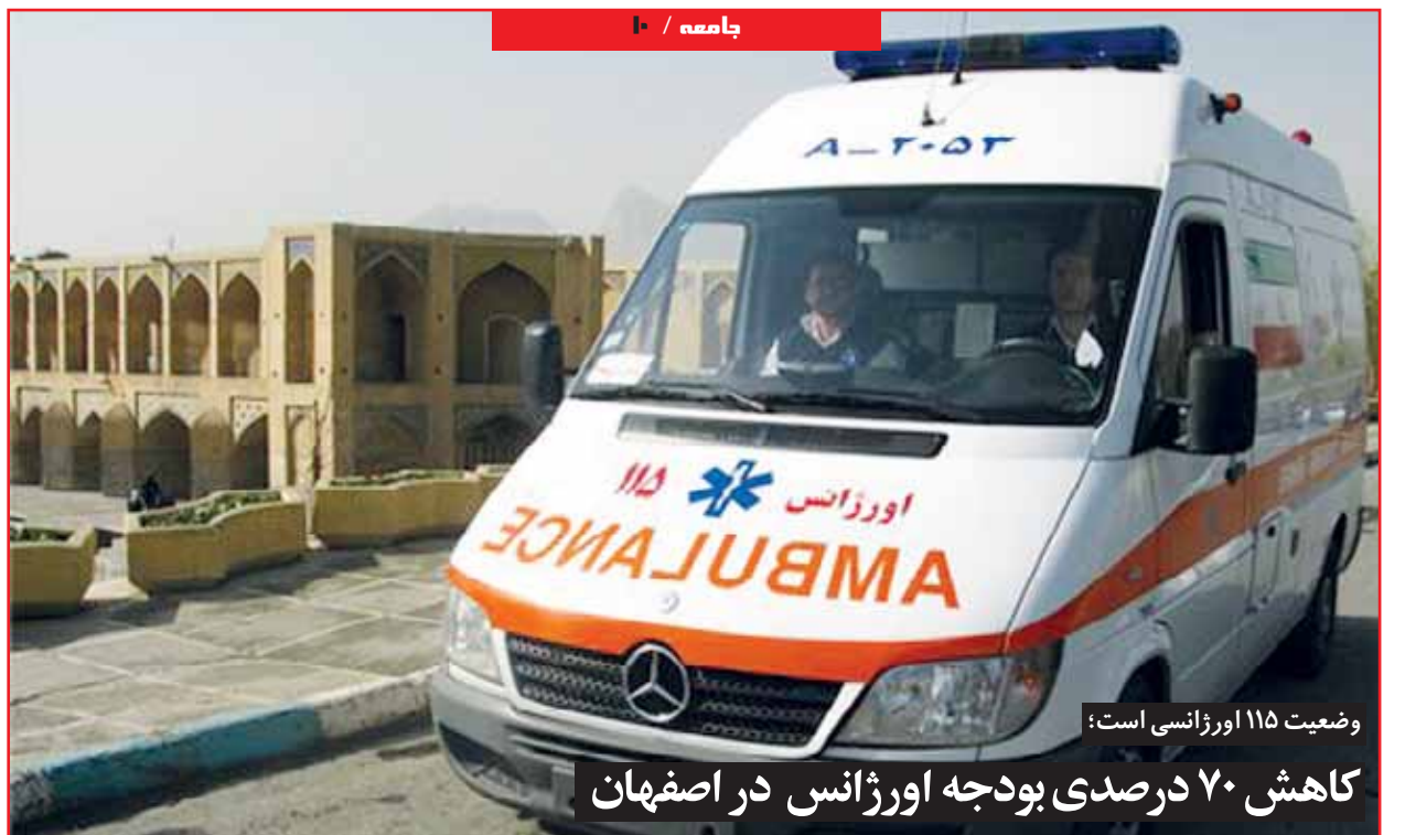
وضعیت ۱۱۵ اورژانسی است: