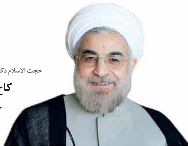
حجت الاسلام دکتر روحانی پس از بازگشت از نیویورک در فرودگاه مهرآباد اعلام کرد:

کاخ سفید در تماسی با سفیر ایران خواستار گفت‌وگوی تلفنی شد