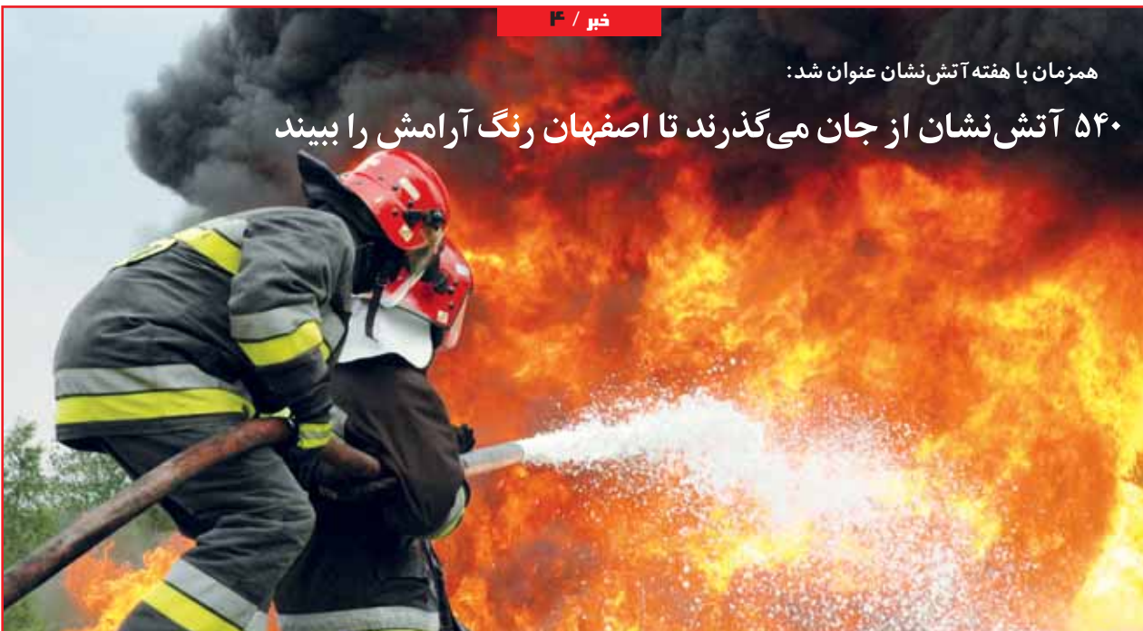
همزمان با هفته آتش نشان عنوان شد:

۵۴۰ آتش نشان از جان می‌گذرند تا اصفهان رنگ آرامش را ببیند