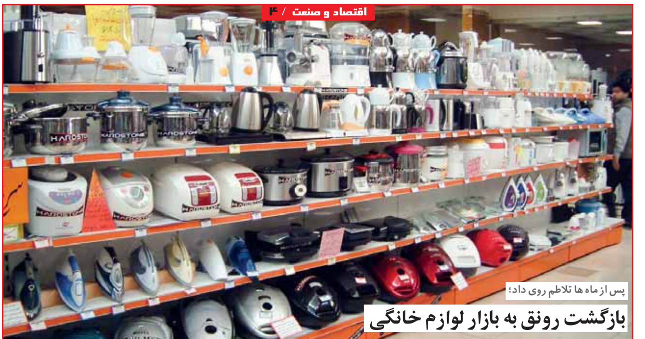
پس از ماه‌ها تلاطم روی داد؛