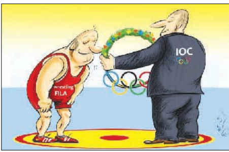
بقای کشتی در المپیک