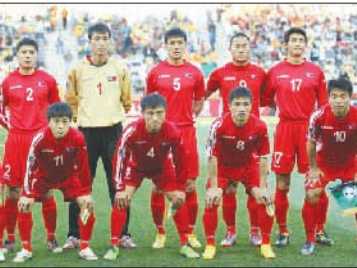
تیم ملی فوتبال کره شمالی در جریان مسابقات جام جهانی ۲۰۰۶