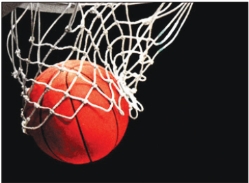
تیم ملی بسکتبال ایران در جریان مسابقات جام جهانی ۲۰۰۶