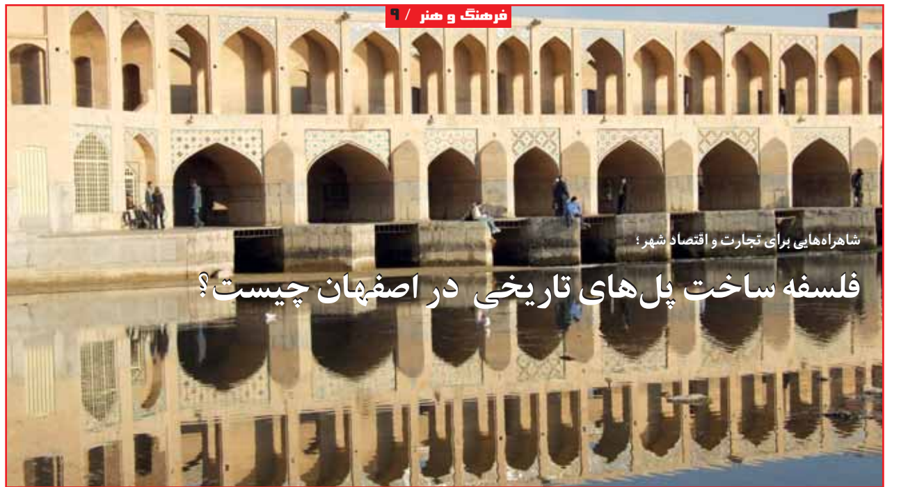
شاهراهایی برای تجارت و اقتصاد شهر؛