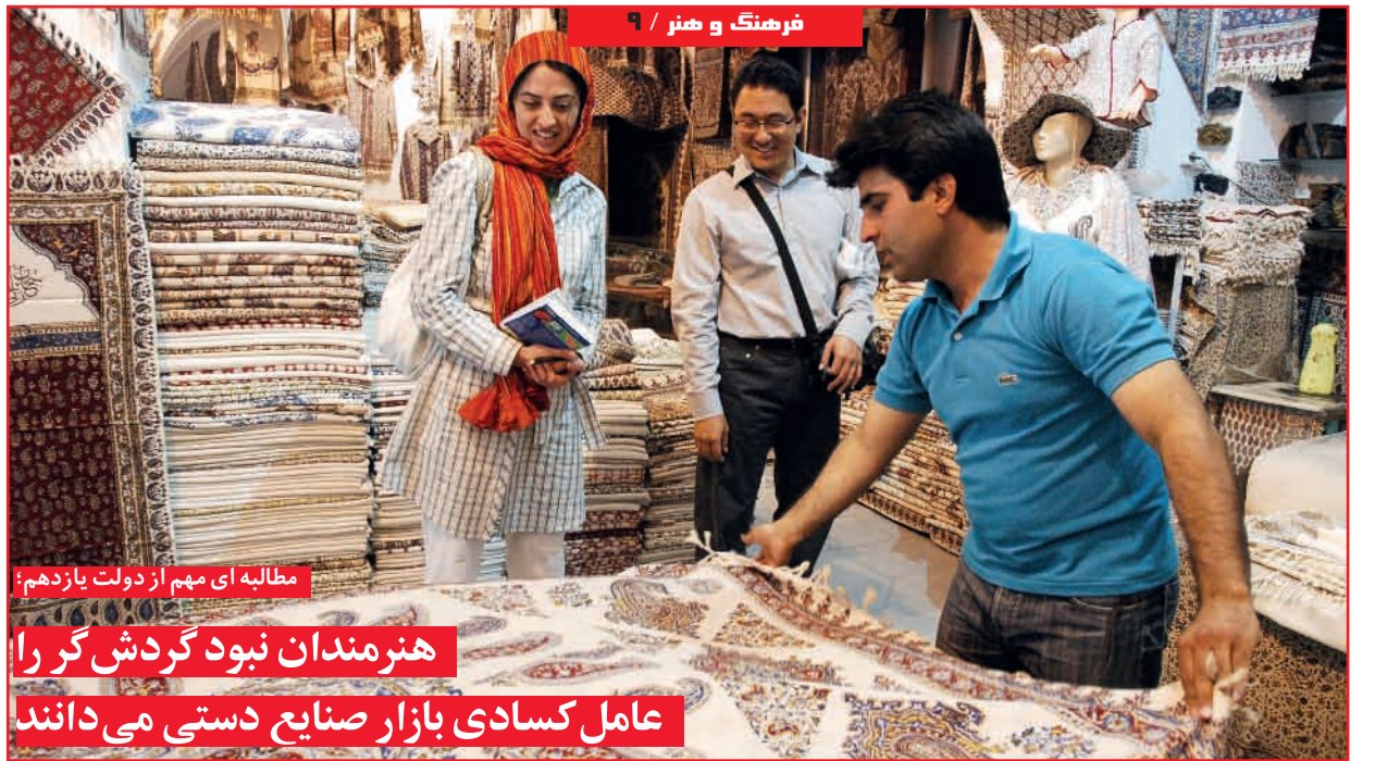
مطالبه ای مهم از دولت یازدهم: هنرمندان نبود گردشگر را عامل کساد بازار صنایع دستی می دانند