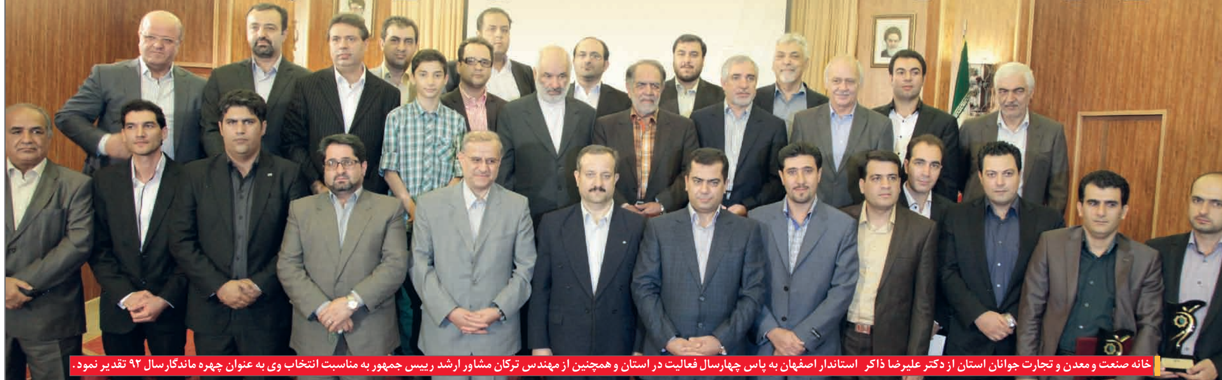
خانه صنعت و معدن و تجارت جوانان استان از دکتر علیرضا ذاکر استاندار اصفهان به پاس چهار سال فعالیت در استان و همچنین از مهندس ترکان مشاور ارشد رییس جمهور به مناسبت انتخاب وی به عنوان چهره ماندگار سال ۹۲ تقدیر نمود.