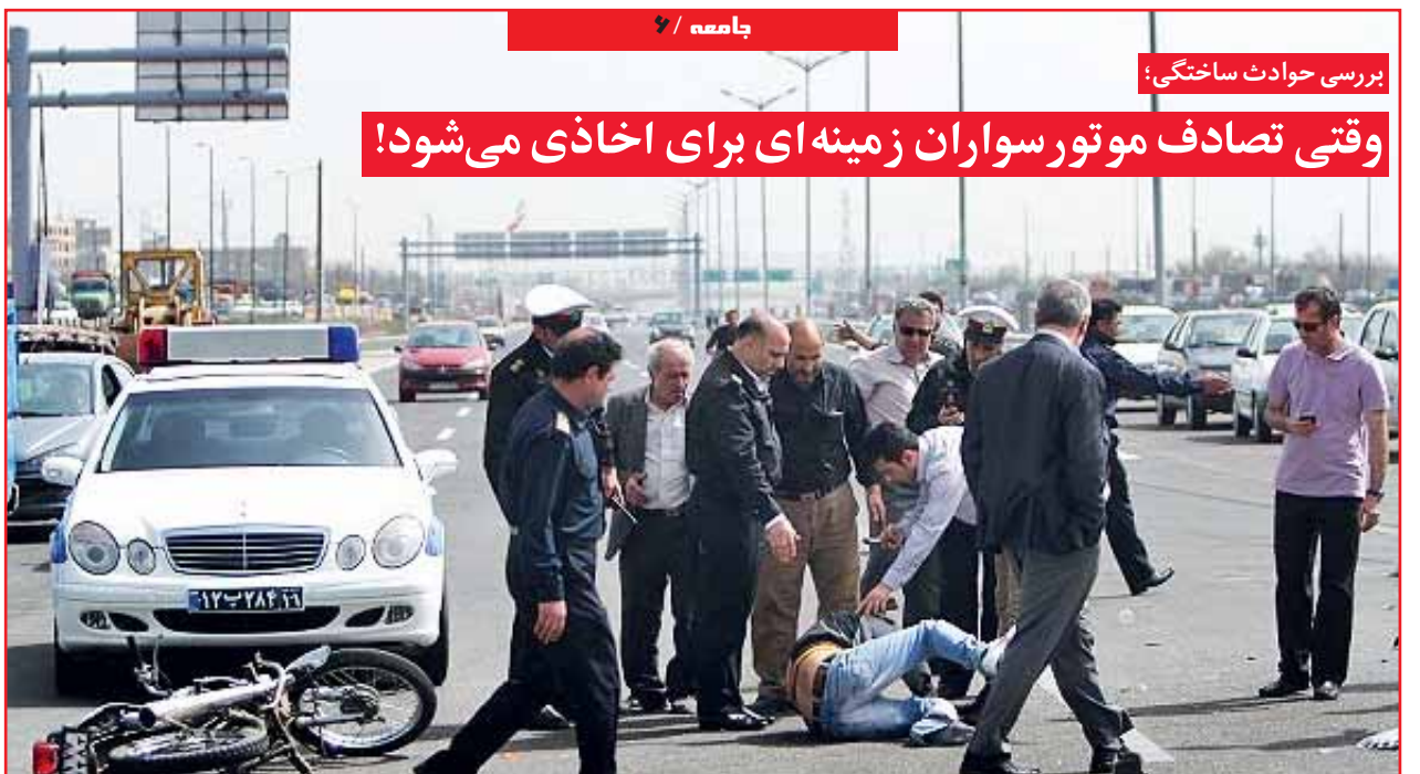
بررسی حوادث ساختمانی:

وقتی تصادف موتورسواران زمینه ای برای اخذ می شود!