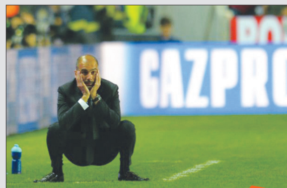
عجیب ترین عکس گوار دیولا و البته تاریخ سوپر جام اروپا...