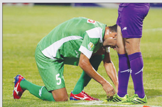
گویا در ایروان به بچه‌ها بستن بند کفش یاد نمی‌دهند، حداقل کاسپاروف که انگار بلد نیست.