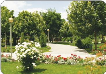
سرپرست سازمان پارکها و فضای سبز

فضای سبز اصفهان برای حفظ شادابی به ۵ مترمکعب در نائیه آب نیاز دارد