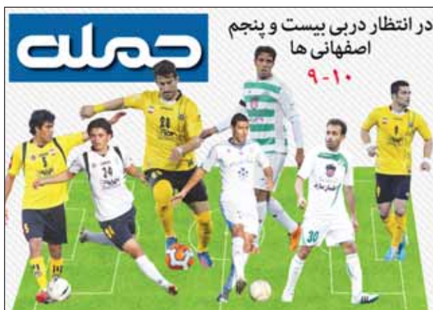
در انتظار دربی بیست و پنجم اصفحانی ها ۹-۱۰ حمله