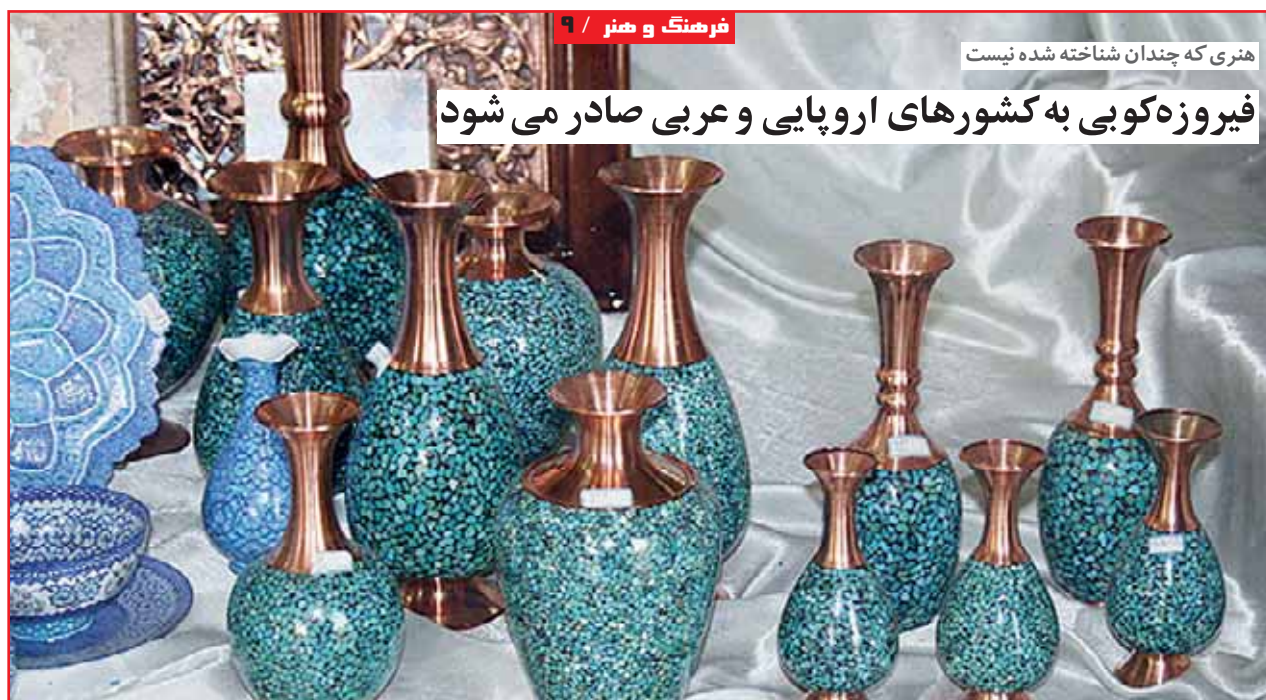
هنری که چندان شناخته شده نیست فیروزه کوبی به کشورهای اروپایی و عربی صادر می شود