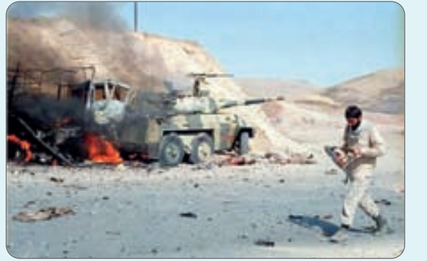
تصاویری از شکست منافقین در عملیات مرصاد