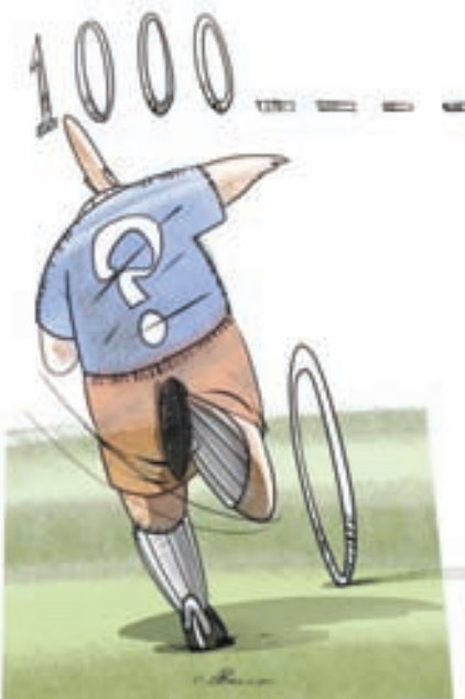
تلاش بازیکنان برای افزایش صفر قرار دادهایشان