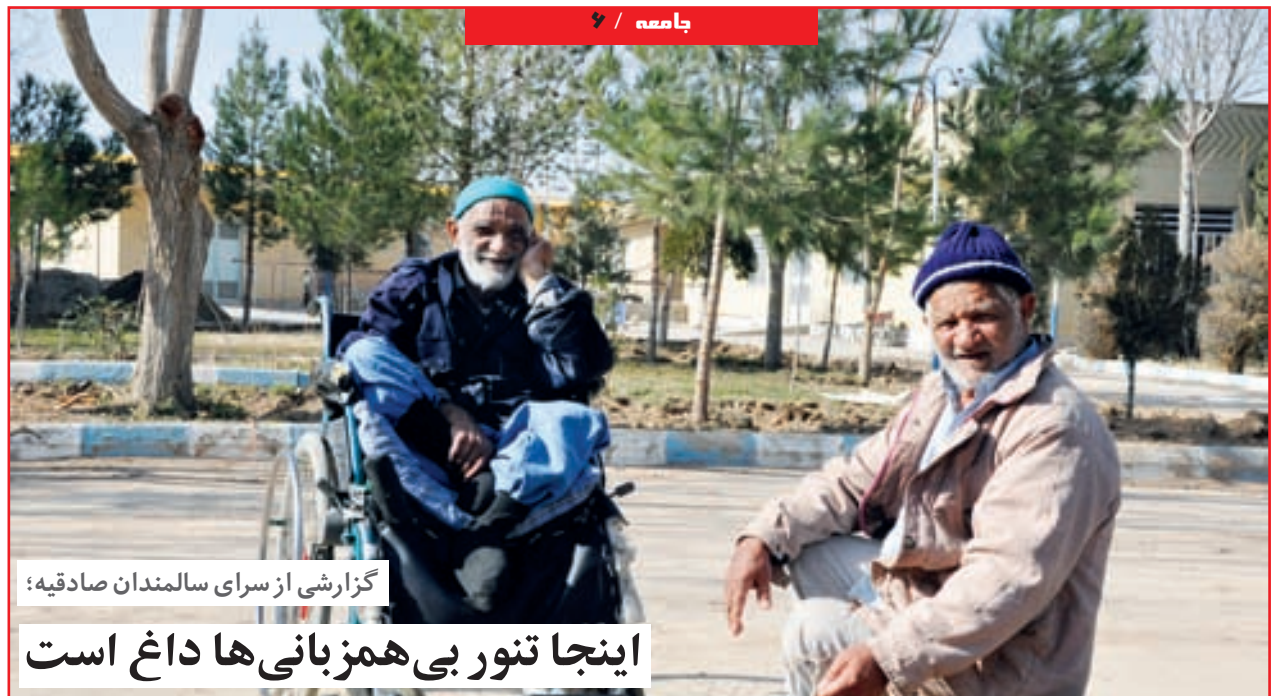
گزارشی از سرای سالمندان صادقیه: