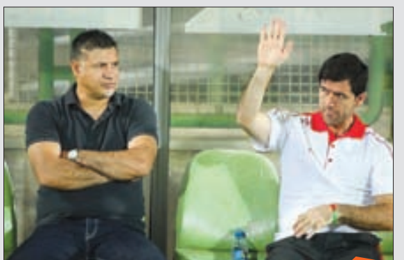
زوج دایی و باقری در تیم ملی سال های درخشانی را رقم زدند حالا باید منتظر باشیم و ببینیم این زوج در پرسپولیس چقدر جواب می دهند.