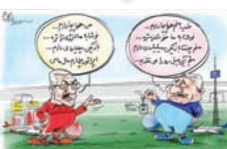
کری خوانی مدیر عاملان استقلال و پرسپولیس