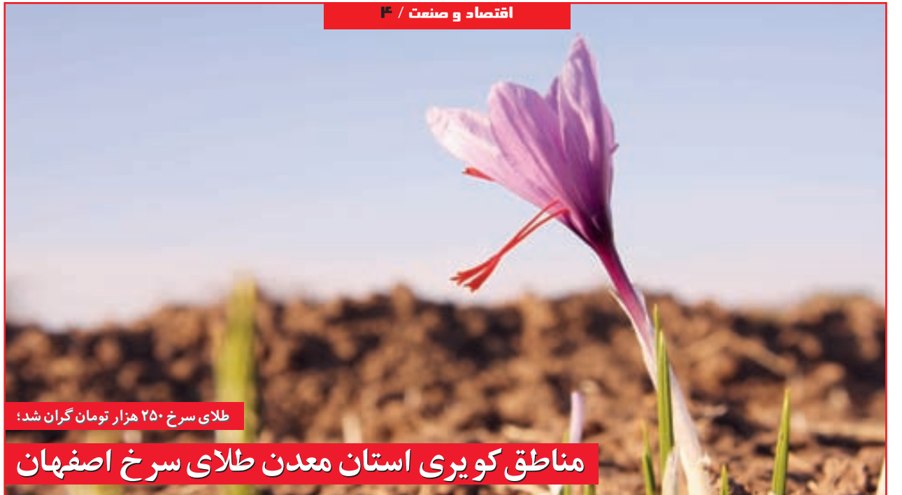
طلای سرخ ۲۵۰ هزار تومان گران شد؛