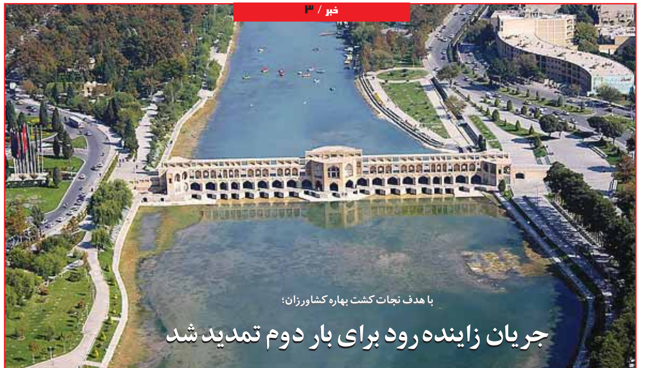
با هدف نجات کشت بهاره کشاورزان؛