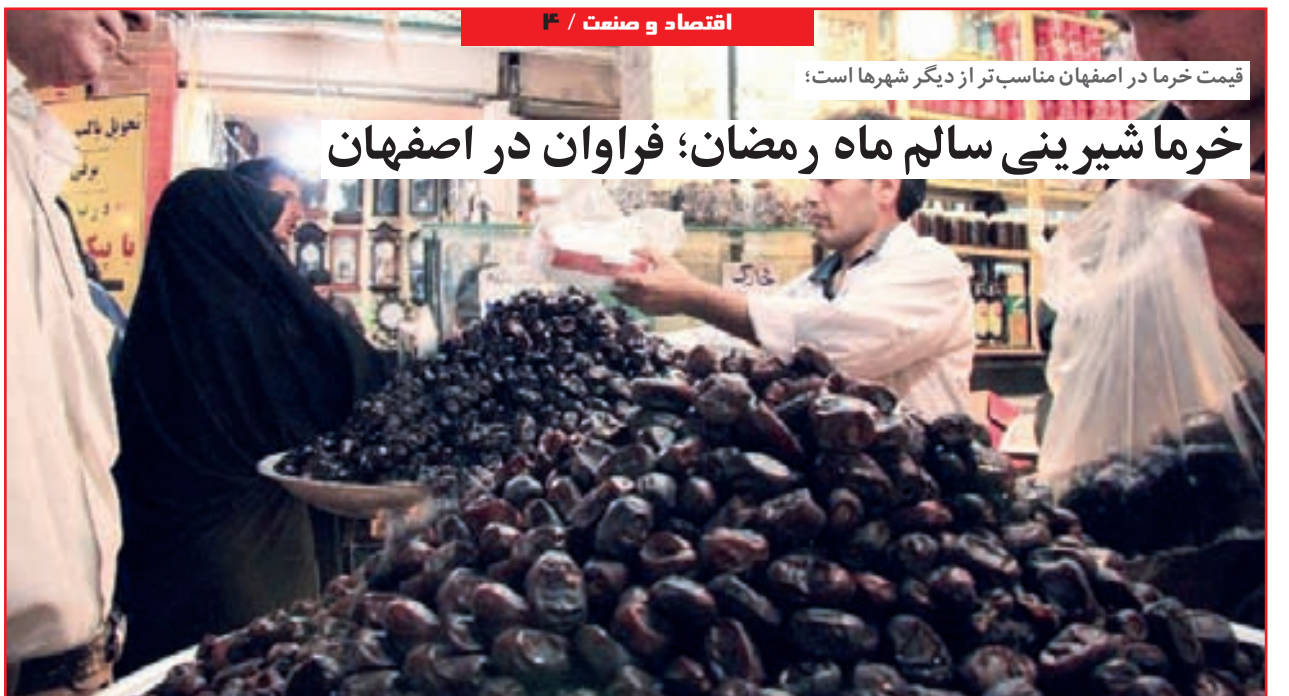
قیمت خرما در اصفهان مناسب‌تر از دیگر شهرها است؛