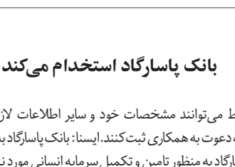
گروه اقتصاد و صنعت