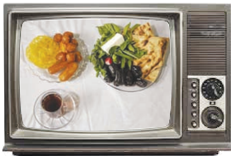
معرفی ویژه برنامه های افطاری سیما

شبکه سه پر مخاطب ترین برنامه افطار سال های اخیر را داشته است؛ «ماه عسل» امسال دوباره با حضور احسان علیخانی به عنوان مجری و تهیه کننده روی آنتن می رود و گروه تولید تقریباً تا به حال خبری از جزئیات برنامه منتشر نکرده اند. گویا سعی شده امسال ساختار کلی برنامه که مخاطب به دیدن آن عادت دارد، به هم نخورد. در واقع «ماه عسل» مثل سال های گذشته هر بار با حضور دو طیف مهمان و یک موضوع مشترک روی آنتن می رود. موضوعاتی که انتخاب شده نیز به دغدغه های اجتماعی و اخلاقی مربوط می شود. پیوندی، کارگردان مجموعه در مورد مجری ماه عسل نیز گفته، صندلی «ماه عسل» متعلق به همه مردم بوده و انحصاری نیست. بنابراین هر کس که قصه ای در زندگی اش دارد می تواند روی آن بنشیند. ما برش هایی از قصه های زندگی مردم را در برنامه روایت می کنیم. آدم هایی که نباید ساده از کنارشان بگذریم. بخشی از برنامه نیز به پخش پلی بکها اختصاص دارد که متناسب با موضوع اصلی از زندگی انسان ها در قالب مستند روایت می شود. گرچه بیشتر مردم با افراد در استودیو آشنا می شوند و قصه های زندگی شان روی صندلی برنامه روایت می شود.