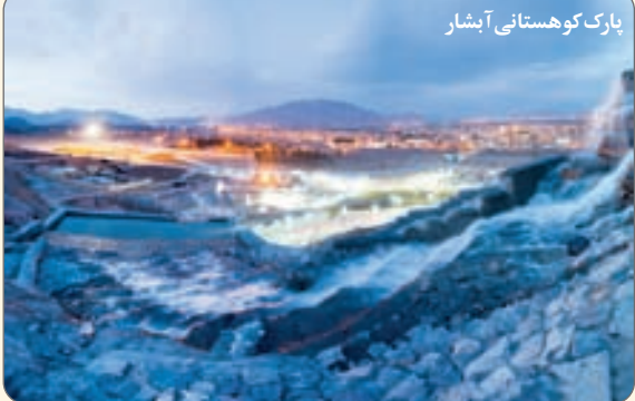
پارک کوهستانی آبشار