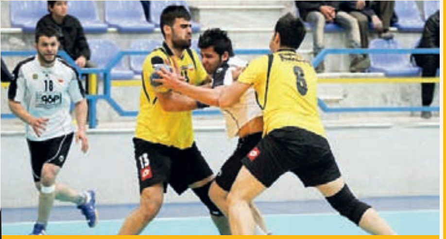
زور رسانه‌ها و جامعه ورزش به سیاهانی‌ها نرسید؛

بحث تیم هندبال سیاهان تنها مسأله مربوط به یک رشته باشگاهی نیست و هندبال اصفهانی را در بر می‌گیرد که سال‌ها تغذیه‌کننده هندبال ملی ایران بود و مقاله نقره بازی‌های آسیایی را در بر می‌گرفت و از این رو انتظار می‌رود شخص مدیر کل به عنوان متولی فعلی ورزش اصفهان با درک موقعیت پیش‌رو، هر آنچه در توان دارد برای تیم هندبال سیاهان به انجام برساند زیرا چنین توقعی از مدیر کل وجود دارد.