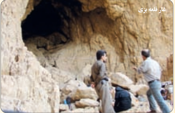
غار قلعه بزّی

وی در خصوص مهمترین پروژه اجرا شده تصریح کرد: مهمترین پروژه‌ها همیشه باید براساس نیاز مردم منطقه باشد و در شهر دیزپچه نیز مهمترین پروژه که نیاز مردم شهر بود، احداث بزرگراه امام رضا(ع) بودکه در اصل بدلیل مهمترین معضل شهرکه همانا عبور زیاد کامیون‌ها و ماشین‌های سنگین از داخل شهر بوده اجرا شد. چرا که شاهد ترافیک‌های سنگین و تصادفات وحشتناک در شهر بودیم که‌آسایش و امنیت مردم را گرفته بود از این رو باید مسیر عبور کامیون‌های سنگین از داخل شهر جدا می‌شد در نتیجه با انجام کار مطالعاتی و برنامه‌ریزی، مسیری به عنوان کمربندی و تحت نام بزرگراه امام رضا(ع) احداث شد. نادری به پروژه مهم دیگر که با این پروژه پیوند خورده اشاره و خاطرنشان کرد: طرح دیگری