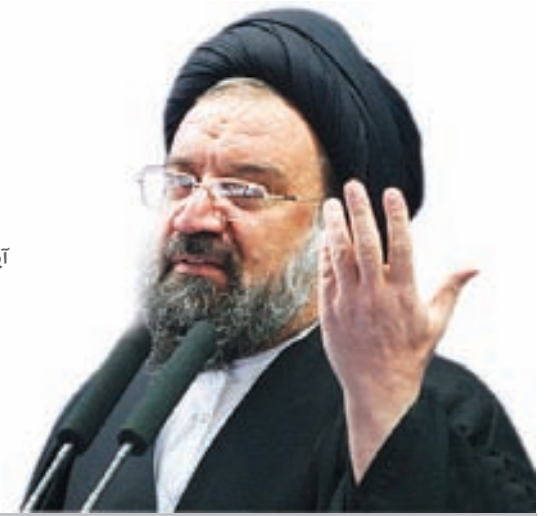
آیت‌الله سیداحمد خاتمی با اشاره به وقایع سیاسی ماه رمضان اسامیل تاکید کرد: