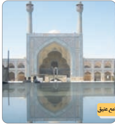
مسجد جامع عتیق