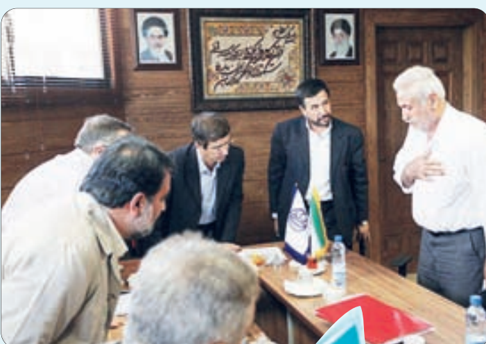
ملاقات مردمی شهردار اصفهان با شهروندان منطقه ۷