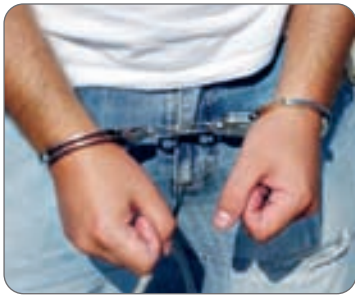
فرمانده انتظامی استان اصفهان خبر داد:

پلیس مبارزه با مواد مخدر استان در راستای ممنوعیت ورود مواد افیونی و مخدر و دستگیری قاچاقچیان چندین طرح عملیاتی و انتظامی را به مرحله اجرا گذاشتند. وی افزود: در یکی از عملیات ها که شب گذشته انجام شد مامورین خودروی سواری سمند را که قصد داشت در پوشش خانواده با ورود به اصفهان مقادیری قابل توجه مواد مخدر را منتقل کند شناسایی و متوقف کردند.