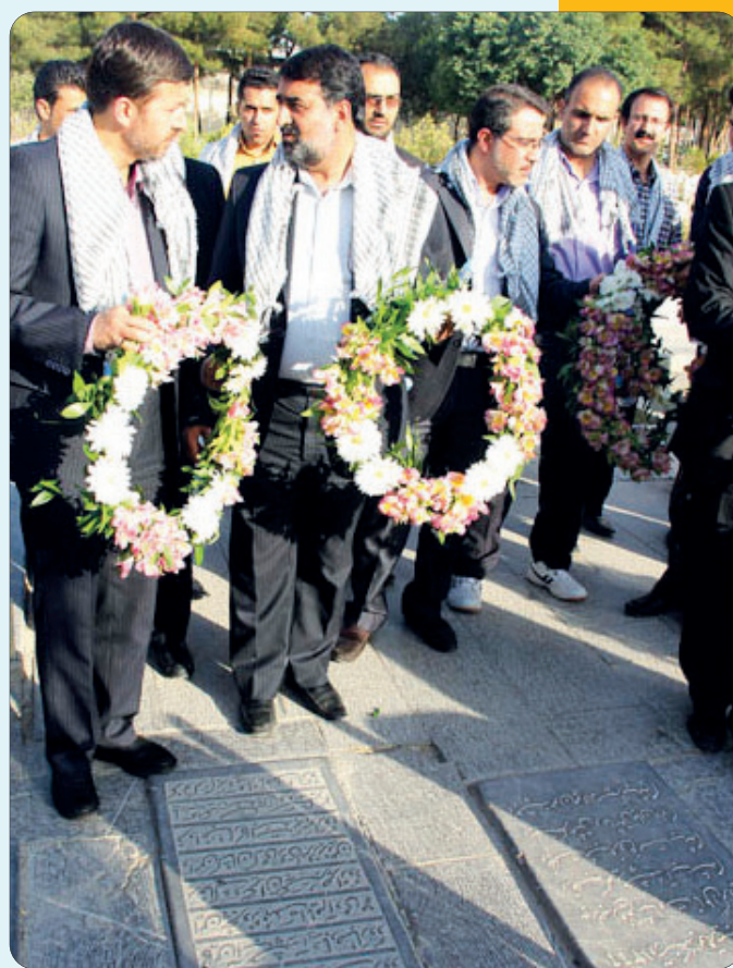
تجدید میثاق مدیران شهری با شهدای انقلاب اسلامی