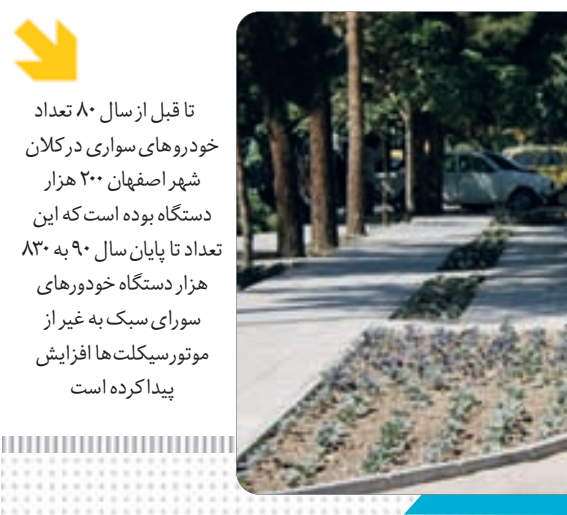
خودروهای فرسوده در خیابان‌های اصفهان

واحد نیز بعد از ۱۰ تا ۱۵ سال خودروهای فرسوده هستند و تعداد زیادی از این اتوبوس ها فرسوده اند اما اتوبوسرانی نمی‌تواند همه آنها را از رده خارج و حمل و نقل را به تأخیر بیندازد.