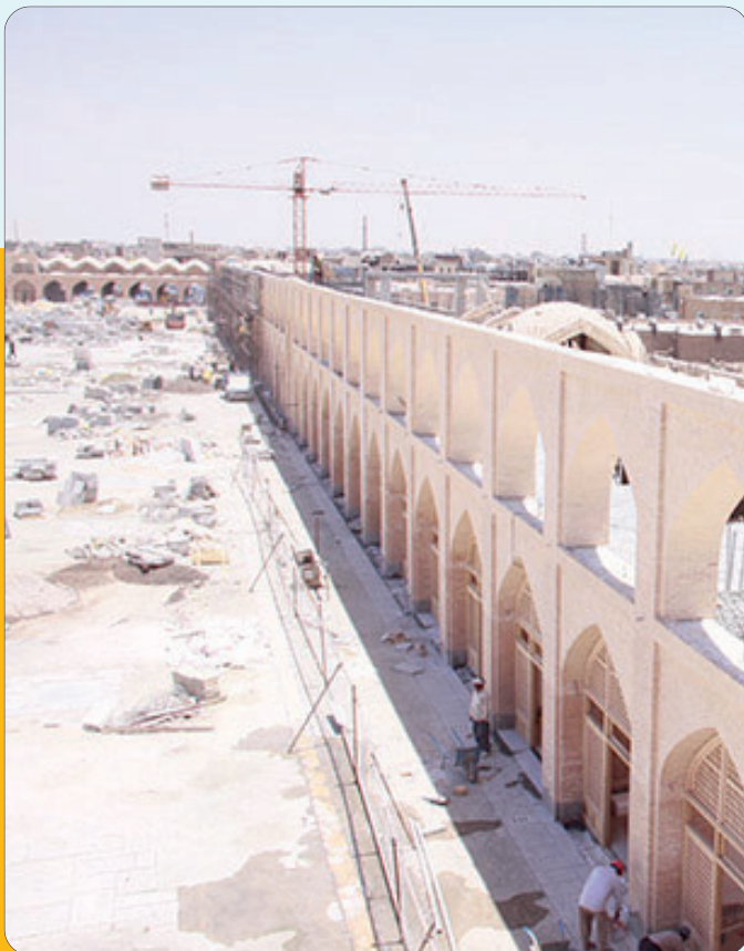
روند پیشرفت میدان امام علی(ع)