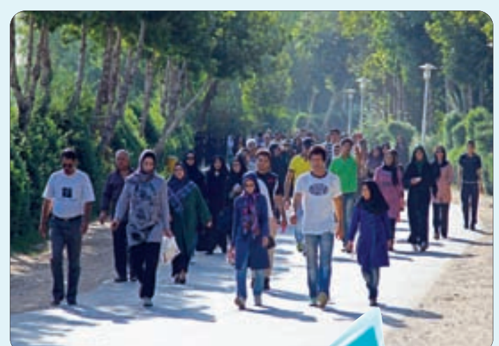
همایش پیاده روی خانوادگی به مناسبت روز شهرداری‌ها