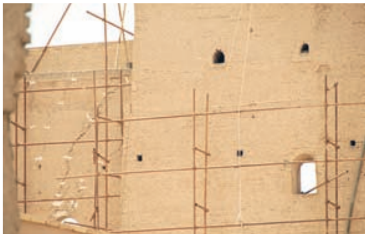
گردشگران امیر چخماق را نام میدانی در شهر یزد می‌دانند که در آن بنایی چند طبقه، مسجد و حسینیه‌ای به

البته مسلم است در آن زمان، این مکان نقش حسینیه را نداشته، چون ساخت چنین فضاهایی از زمان صفویه به بعد در ایران رواج پیدا کرده‌است. این حسینیه توسط یکی از فرمانروایان یزد خراب شد، اما هم‌اکنون در حال بازسازی و تبدیل دوباره به حسینیه‌ای است.