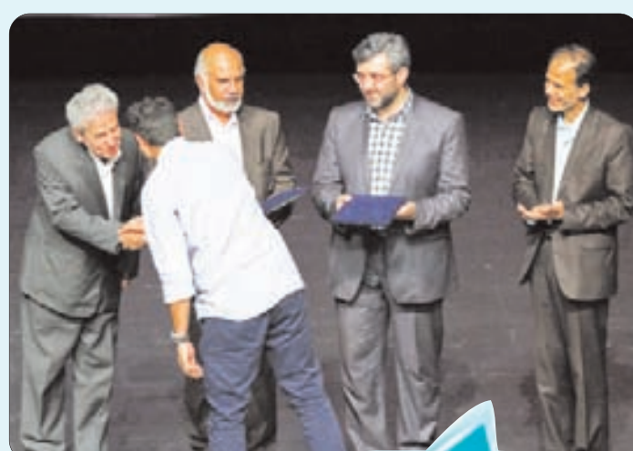
اختتامیه جشنواره نمایش‌های کم‌دنی اصفهان