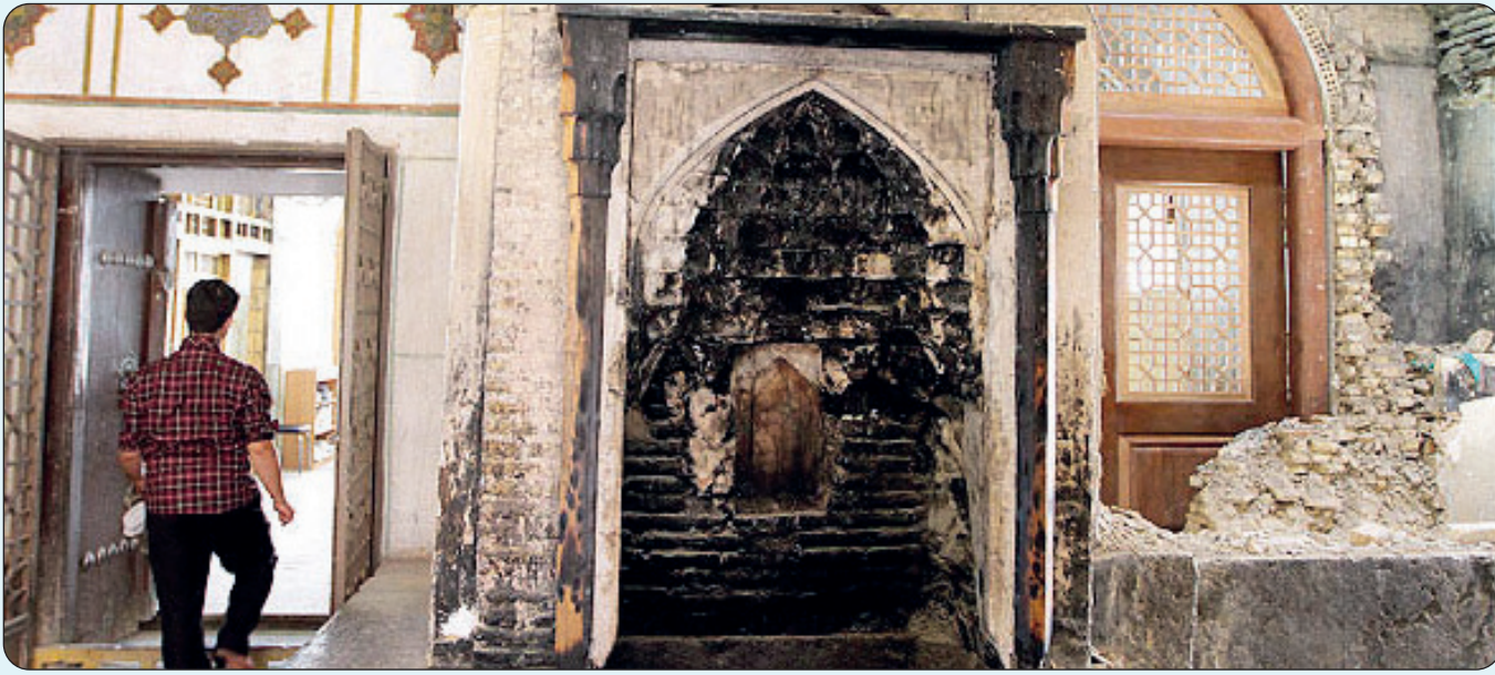
تخریب سقاخانه مسجد جامع اصفهان