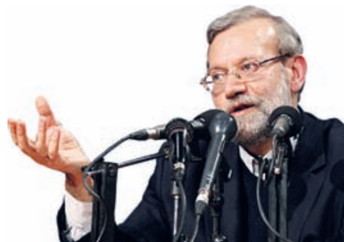
دکتر لاریجانی در پیامی به رئیس مجلس لبنان عنوان کرد:

ماه مبارک رمضان میعاد نورانی برای لیبیک به دعوت الهی