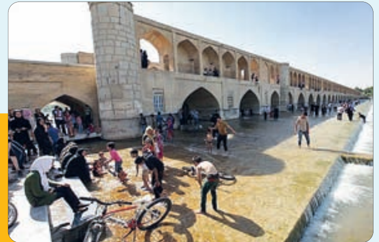
شادی و نشاط مردم اصفهان با جاری زاینده رود