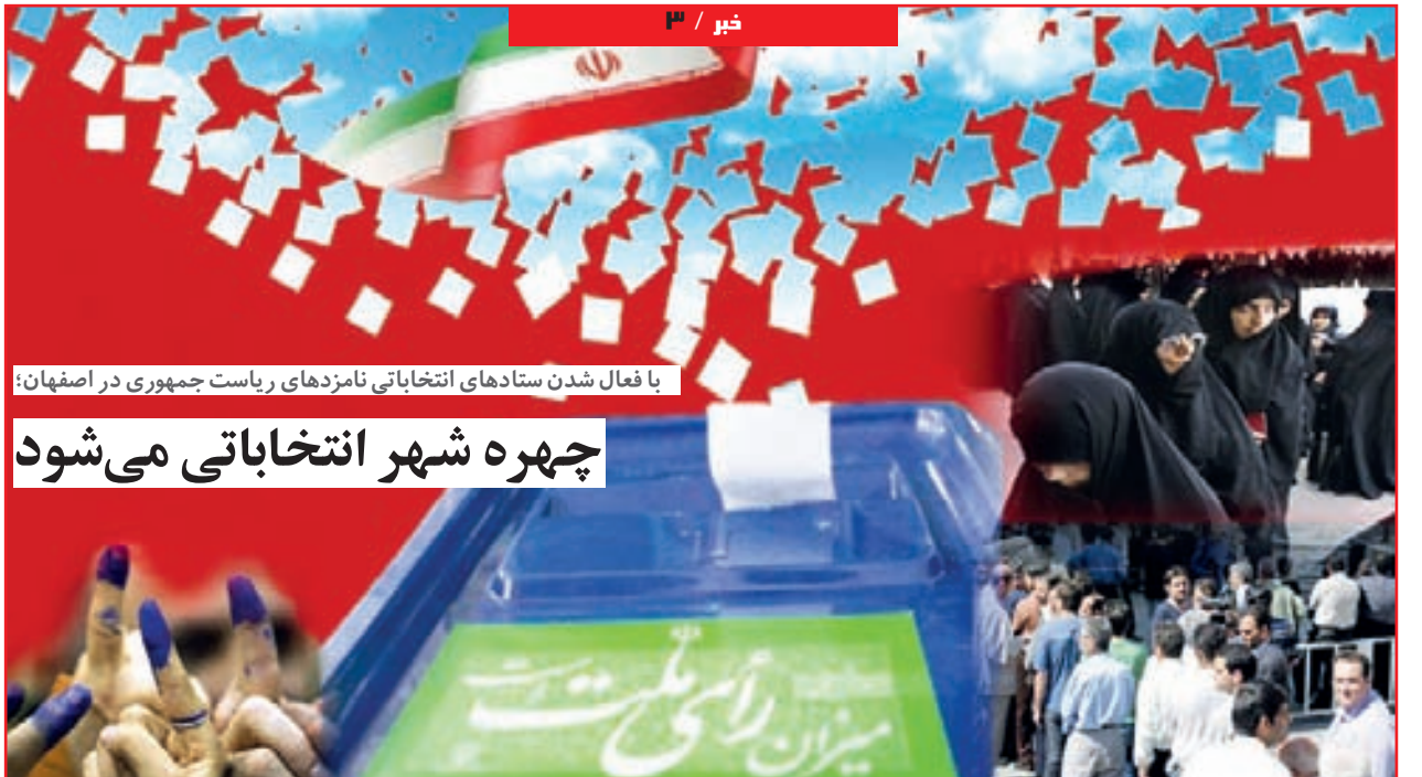
با فعال شدن ستادهای انتخاباتی نامزدهای ریاست جمهوری در اصفهان؛