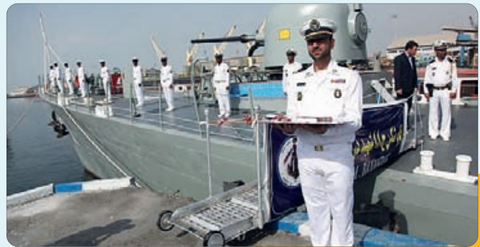
الحاق ناوشکن شهید بایندر به ناوگان نیروی دریایی ارتش