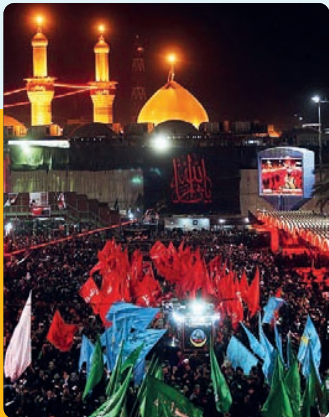
حرم مطهر امام حسین (ع)