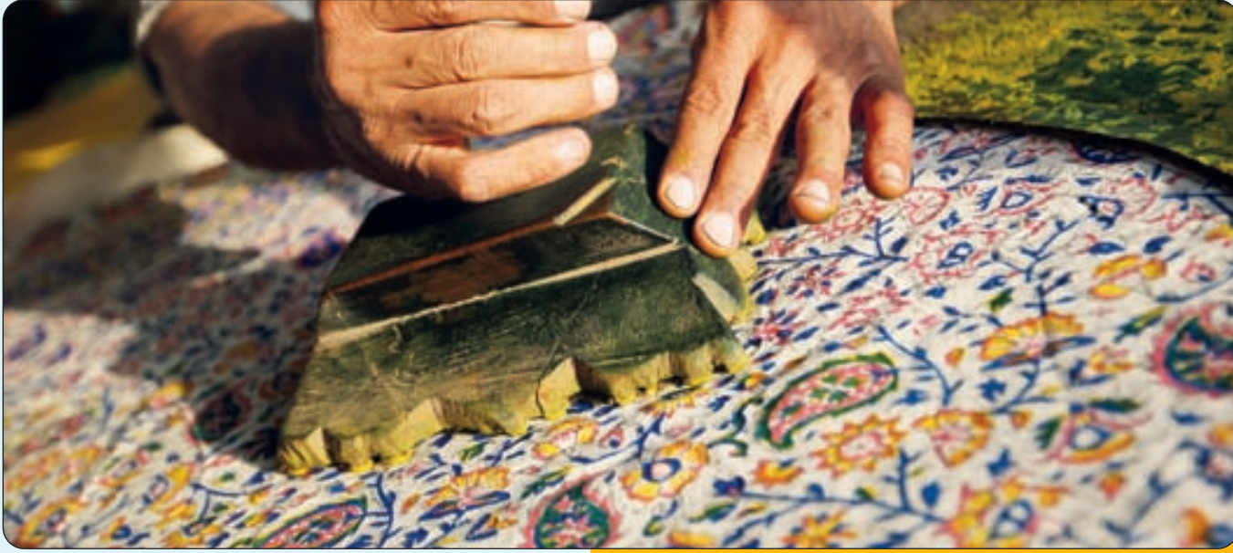
به مناسبت روز جهانی صنایع دستی