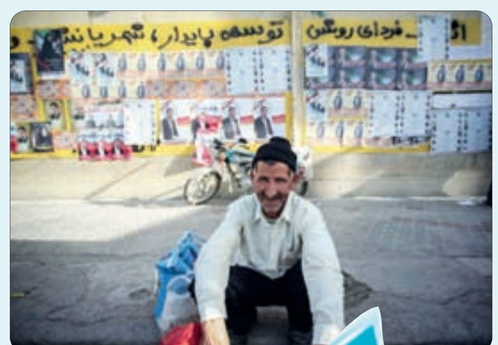
فضای شهر در آستانه انتخابات