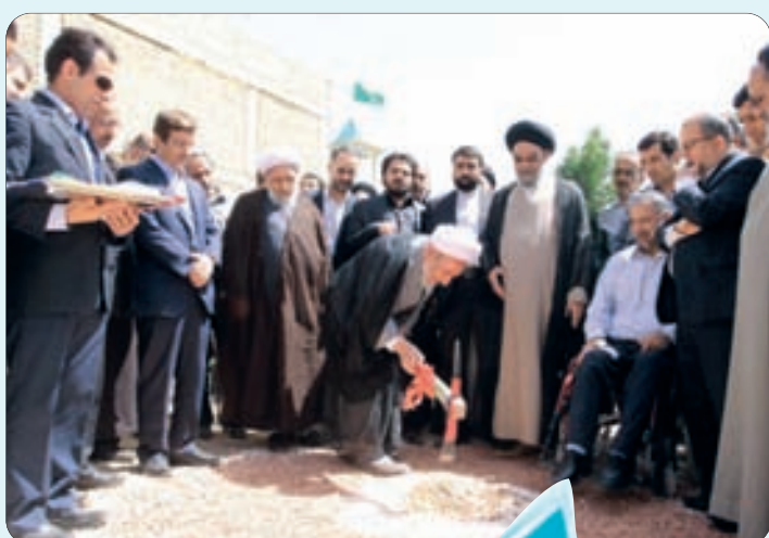
کلیک زنی مساجد سپاهان شهر اصفهان