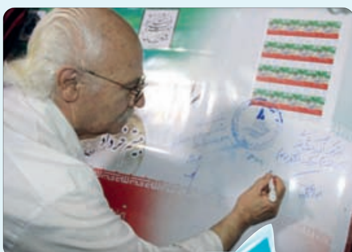
مراسم رونمایی روز جهانی صنایع دستی