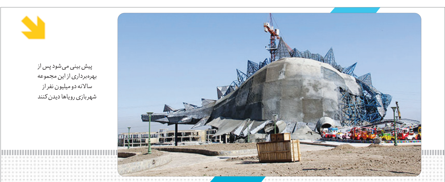
گزارش گروه شورا

شهر بازی بزرگ اصفهان با مشارکت سرمایه‌گذار چینی به عنوان بزرگترین مرکز تفریحی و اقامتی کشور و در فضایی به مساحت ۲۰ هکتار در شرق اصفهان در حال احداث می باشد. تاکنون برخی از قسمت های این شهر بازی ۹۸ درصد پیشرفت فیزیکی داشته است شهر بازی رویاها یکی از کارهای مهمی است که از سوی مدیریت شهری به اجرا درآمده است و در دوره سوم شوروها توجه ویژه ای به مباحث فرهنگی و تفریحی مردم شده است. با توجه به اینکه یکی از درخواست های مردم ایجاد مراکز تفریحی بوده است از این رو احداث پروژه شهربازی رویاها در دستور کار قرار گرفت. لازم است فضاهای عمومی با توجه به ارزش های اسللامی آماده سازی شود در این مجموعه، آموزش در کنار تفریح برای بازدید کنندگان پیش بینی شده و شهروندان در سین مختلف می توانند با حضور در مجموعه شهر رویاها یک روز خوب با جاذبه های تفریحی و تجربیات علمی را پشت سر گذارند.