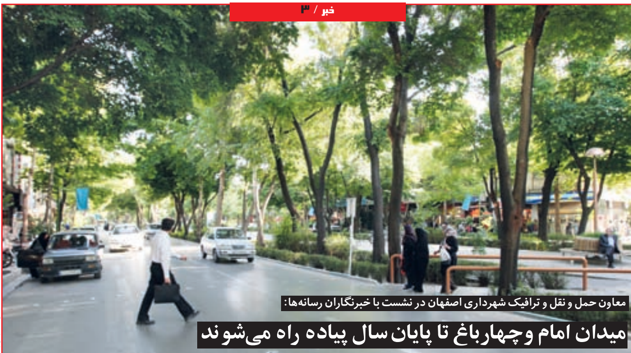
معاون حمل و نقل و ترافیک شهرداری اصفهان در نشست با خبرنگاران رسانه ها:

میدان امام و چهارباغ تا پایان سال پیاده راه می شوند