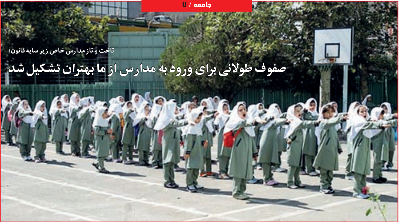
تاخت و تاز مدارس خاص زیر سایه قانون؛ صفوف طولانی برای ورود به مدارس از ما بهتران تشکیل شد

گزارشی از همایش سه روزه هنر و ریاضیات در خانه ریاضیات اصفهان: