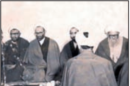
حضرت آیت الله میرزا هاشم آملی ، لریجانی و حضرت آیت الله عبدالله جوادی

من قریب دوازده سال در محضر ایشان بودم . در این سالیان، درس‌های ماشب‌ها بود بعد از نماز مغرب و عشا تمام منظومه به غیر از منطق منظومه، و از اول الهیات اسرار تا آخر آن، و از اول نطق چهارم اشارت تا آخر آن را در خدمت جناب آقای قمشه ای خواندم . هر چند نزد اسنادیت دیگر هم برای خوشه چینی رفتم . مثلا سه نمر آخر اشارات را هم خدمت آقای قمشه ای خواندم و هم خدمت آقای شعرانی، اسفارا هم خدمت هرسه بزرگوار آقایان قمشه ای و قزوینی و شعرانی ،