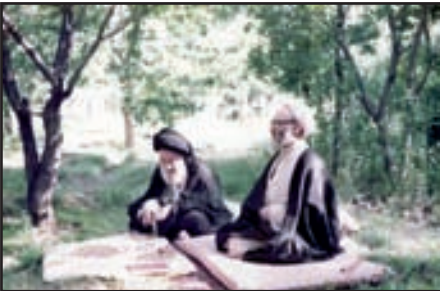
حضرت آیت الله سید عبدالکریم کشمیری و علامه حسن زاده آملی

در حالی تحصیلات کتب ابتدائیه را که در میان طلبأ علوم دینیّه معمول و متداول است از نصاب الصبیان و رساله عملیه فارسی آیت‌الله سید ابوالحسن اصفهانی (چون ایشان مرجع عالی‌الاطلاق درآن زمان بودند) و کلیات سمعی، گلستان سعادی و جامع المقدمات و شرح الفیه سیوطی و حاشیه ملاعبدالله بر تهذیب منطق و شرح جامی برکافیه نحو وشمسیه در منطق و شرح نظام در صرف، مطول در معانی و بیان وبدیع و معالم دراصل، تبصره در فقه و قوانین در اصول تا مبحث عام وخاص را درآمل که همواره از قدیم الدهر واجد راجل علم بوده، از محضر مبارک روحانیین آن شهر آیات عظام و حجج اسلام: محمد آقا غروی و آقا عزیرالله طبرسی و آقا شیخ احمد اعتمادی و آقا عبدالله اشراقی و آقا ابوالقاسم رجائی و غیرهم که همگی از این دنیا رخت برپسته اند، فرا گرفت و نیز از حضرت آیت‌الله عزیرالله طبرسی تعلیم خط می گرفت تا اینکه خود حضرتش درآمل چند کتاب مقدماتی را تدریس می کرد.