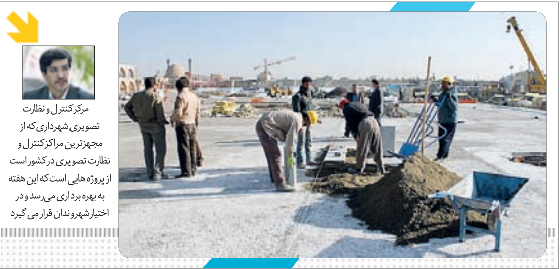
فضای یک زمین ورزشی در اطراف میدان امام علی(ع)

جاری ۵۲۰ میلیارد تومان به حمل و نقل عمومی اختصاص داده‌شده‌است.