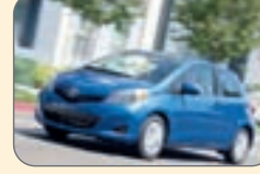
تویوتا یاریس- ۱۴ هزار و ۳۷۰ دلار