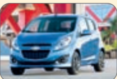
شورلت اسپارک- ۱۲ هزار و ۱۸۵دلار

در این مطلب فهرستی از ارزان ترین خودروهای هاچبک وجود دارد که در بازارهای جهانی قیمتی کمتر از ۱۶ هزار دلار دارند.