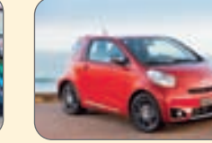
سبون- ۱۶ هزار دلار

سازمان میادین میوه و تره بار وساماندهی مشاغل شهری شهرداری اصفهان در نظر دارد عملیات خرید، حمل و نصب یک دستگاه اکونوپک هواساز با دبی هوای CFM۲۵۰۰۰ با فشار استاتیکی کلی فن ۵/۸inw و ظرفیت گرمایشی کوره keol/hr۲۵۰۰۰۰ کیلوکالری با کلیه متعلقات و محفظه دو جداره به انضمام تابلو برق بصورت کامل و قابل بهره‌برداری واقع در اتوبان فرودگاه، ابتدای خیابان شیخ طوسی را به مبلغ تقریبی ۰۰۰/۰۰۰/۳۶۵ ریال براساس مبلغ پیشنهادی از طریق مناقصه به پیمانکار واجد صلاحیت واگذار نماید . متقاضیان می‌توانند از تاریخ ۱۶/۲/۹۲ تا پایان وقت اداری مورخه ۲۴/۲/۹۲ با ارایه معرفی نامه معتبر و مدارک مربوطه به همراه سوابق کاری شرکت به دفتر فنی سازمان واقع در خیابان سجاد، قائم مقام فراهانی (سپهسالار)، ابتدای کوچه گلستان چهار م مراجعه نموده و پس از اخذ تاییدیه دفتر فنی اقدام به واریز مبلغ ۰۰۰/۰۰۰/۲۰۰ ریال بابت هزینه تهیه اسناد مناقصه در وجه حساب جاری شماره ۰۰۰۰۳۰۴۱۰۰۳۱۰۰۰۰۰۰۰۰ نزد بانک ملی ایران شعبه اصفهان (قابل پرداخت در کلیه شعب بانک ملی) نموده و اسناد مناقصه را دریافت نمایند. تلفن تماس: ۰۸-۲۴۷۷۰۶۳