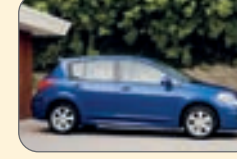
نيسان ورسا- ۱۴ هزار و ۶۷۰دلار