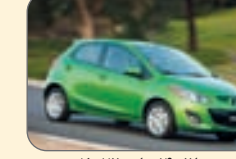
مزدا۳- ۱۴ هزار و ۷۲۰ دلار