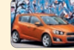
هوندا فیت- ۱۵ هزار و ۲۳۵ دلار