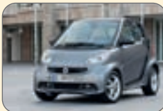
اسمارت فورتو- ۱۲ هزار و ۴۹۰دلار