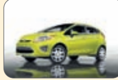
فورد فیستا- ۱۲ هزار و ۵۲۰دلار