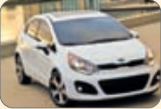
کیا ریو- ۱۲ هزار و ۵۸۰دلار