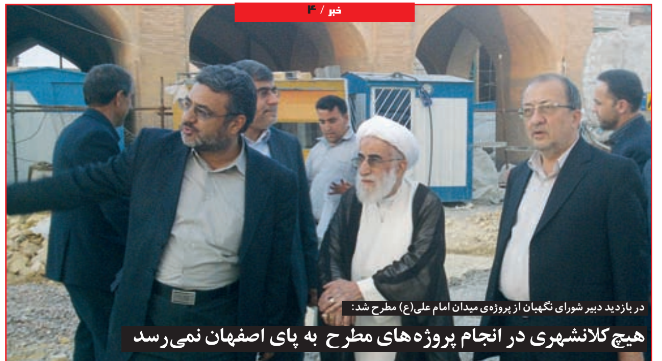
در بازدید دبیر شورای نگهبان از پروژه میدان امام علی (ع) مطرح شد:

هیچ کلانشهری در انجام پروژه‌های مطرح به پای اصفهان نمی‌رسد