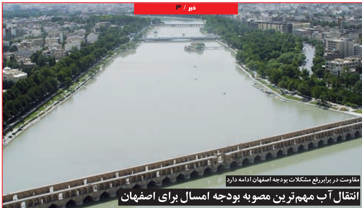
مقاومت در برابر رفع مشکلات بودجه اصفهان ادامه دارد

انتقال آب مهم ترین مصوبه بودجه امسال برای اصفهان