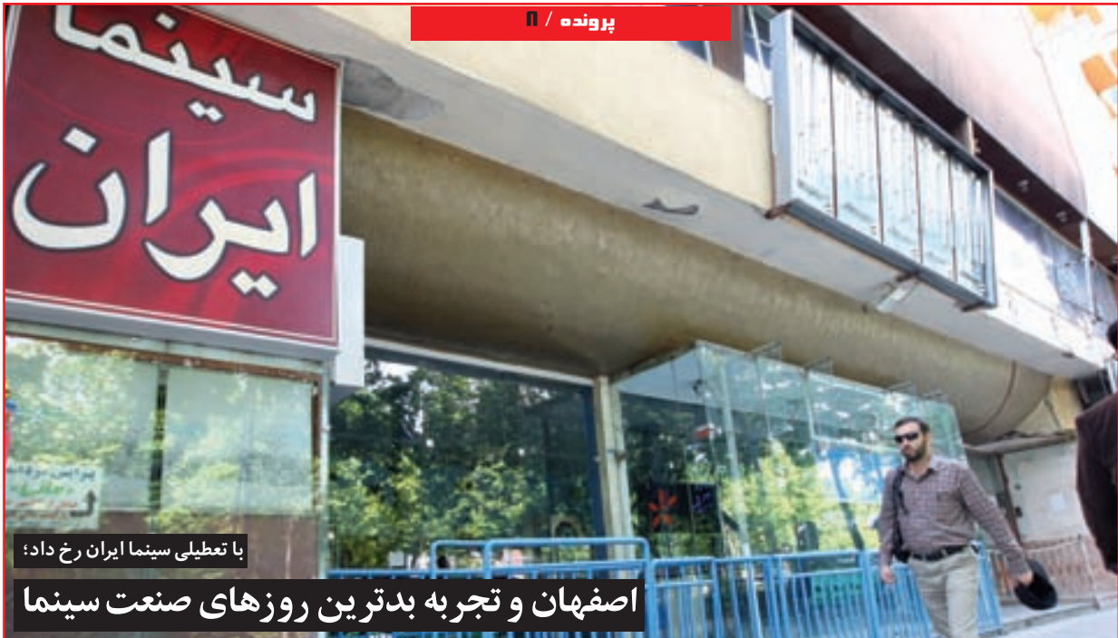
با تعطیلی سینما ایران روزهای صنعت سینما اصفهان و تجربه بدترین روزهای صنعت سینما