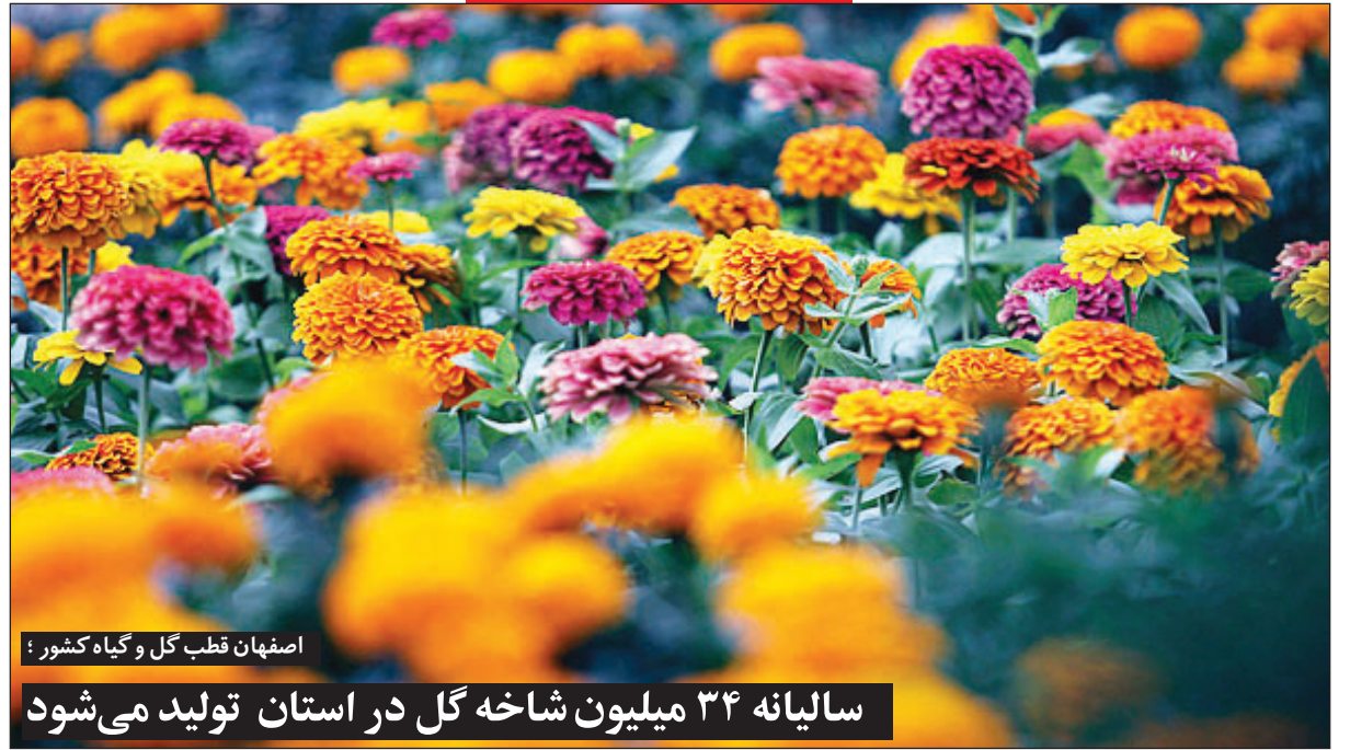
اصفهان قطب گل و گیاه کشور!

سالانه ۳۴ میلیون شاخه گل در استان تولید می‌شود