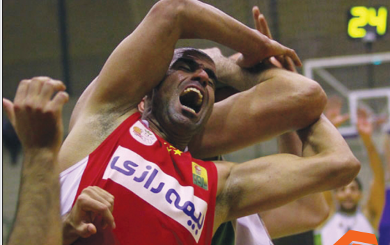
باور کنید اینها دارند بسکتبال بازی می‌کنند