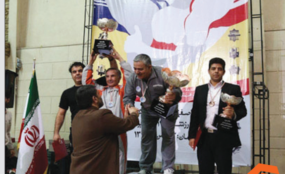
جام باشکوه کلانشهرها