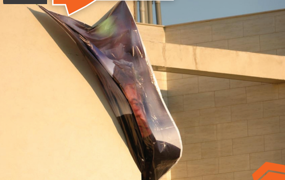
جمع شدن عجیب عکس حجازی در کمپ استقلال