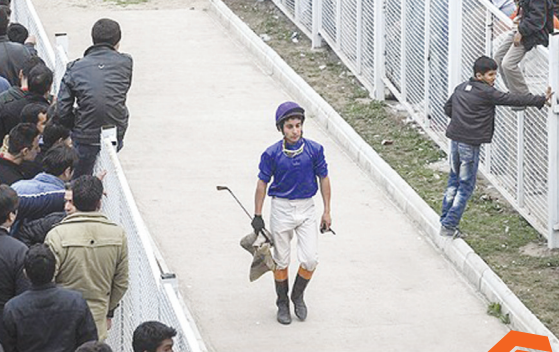
کورس سوار کاری گنبد کاووس / سوار کار بدون اسب