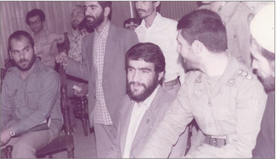
سید حسن قاضی زاده هاشمی و شهید صیاد شیرازی در دوران دفاع مقدس

ویزگیهایی است که وزیر بهداشت را به فردی محبوب در جامعه تبدیل کرده است. و این درس بزرگ دکتر قاضی زاده هاشمی وزیر بهداشت دولت تدبیر و امید به هم قطارانش است که چگونه می شود، حاشیه ساز نبود؛ به فکر مردم بوده؛ و در دولت راست گویان نیز بست داشت. البته این خصلت های جالب وزیر بهداشت، اتفاقی نیست. او کسی است که بعد از پیروزی انقلاب اسلامی به عنوان یکی از مؤسسان سازمان جهاد سازندگی در کشور نقش فعال و مؤثر ایفا نموده و با شروع جنگ تحمیلی نیز مدت ۳۳ ماه به عنوان یکی از طراحان مهندسی رزمی به صورت داوطلبانه در جبهه حضور داشته است و در این مدت هم ۲ بار سابقه مجروحیت دارد. برادر کوچکترش نیز به علت مصدومیت شیمیایی ناشی از دوران جنگ، در سال ۱۳۷۲ به شهادت رسیده است.