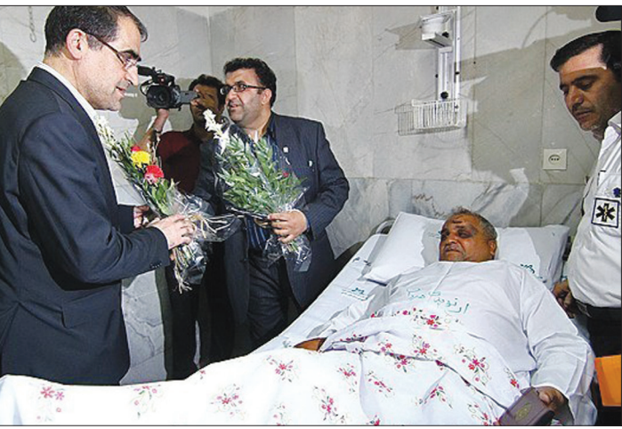
عبادت وزیر بهداشت در مان و آموزش پزشکی از مصدومان سانحه تصادف جاده تهران