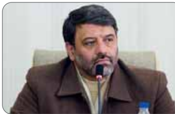
انرژی، اصلاح الگوی مصرف با سبک اسلامی و سیره پیامبران است لذا با استفاده از این منابع غنی می توان

فرهنگ اصلاح الگوی مصرف را در جامعه نهادینه کرد اما متأسفانه حتی افزایش مصرف را داشته ایم. وی اضافه کرد: در آینده نه تنها کشور ما بلکه دنیا با خطر منابع محدود مواجه هستند و یکی از راه های جلوگیری از هدررفت منابع در بخش های مختلف توجه به داشته های معنوی و بیان هایی در مورد لزوم صرفه جویی در فرهنگ غنی کشورمان است. وی همچنین از ساخت و سازهای خلاف در اطراف شهر به دغدغه های برای مدیران و شهروندان تبدیل شده