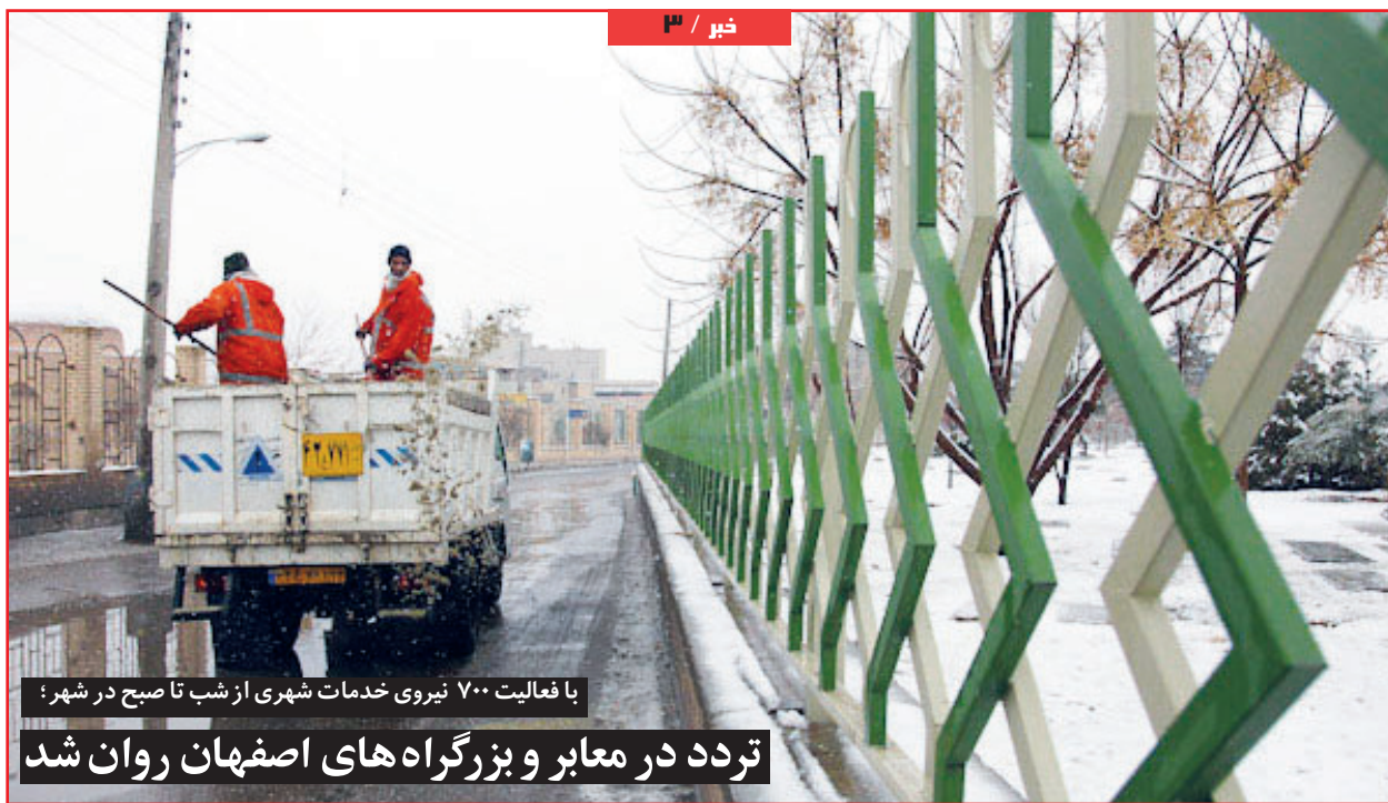
با فعالیت ۷۰۰ نیروی خدمات شهری از شب تا صبح در شهر: تردد در معابر و بزرگراه‌های اصفهان روان شد