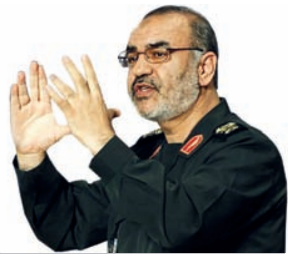
سردار سلامی، جانشین فرمانده کل سپاه در جمع خبرنگاران:

تمام بیانات رهبری مبتنی بر توان دفاعی نیروهای مسلح است