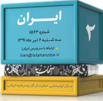
سید نویدمدنی، حمایت از کار و سرمایه ایران