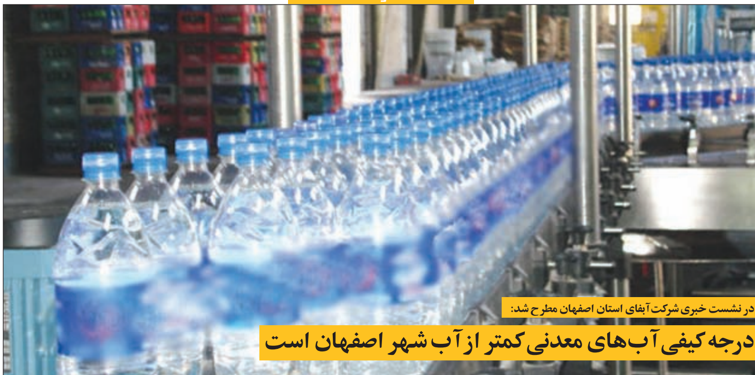
در نشست خبری شرکت آبفای استان اصفهان مطرح شد:

درجه کیفی آب‌های معدنی کمتر از آب شهر اصفهان است